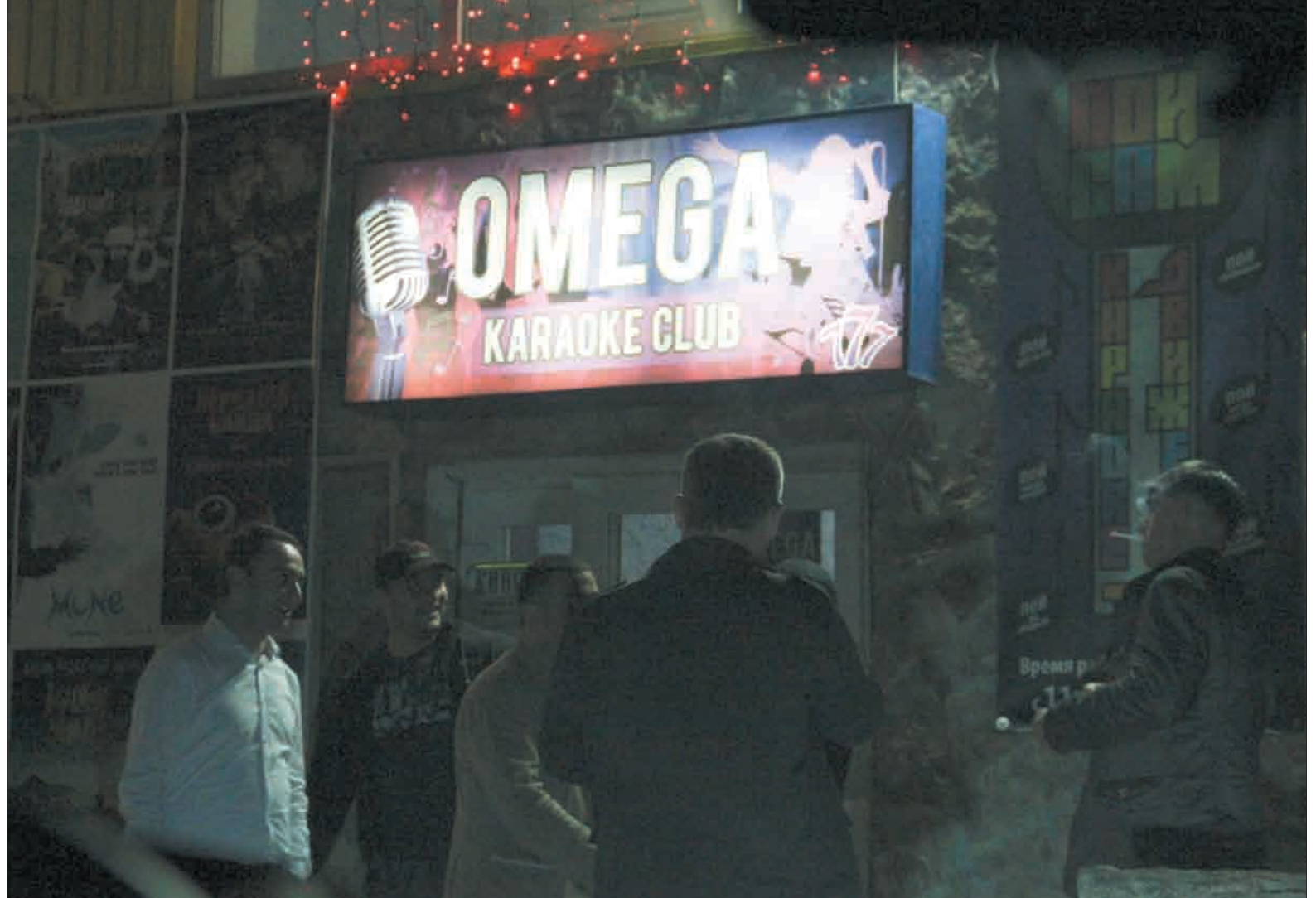
После закрытия развлекательного клуба «Фараон» в подвальном помещении на ул. Брусницына располагались детское кафе и караоке-движение «Пой сам», но ни одно из этих заведений не прижилось. Сменивший их караоке-клуб работает уже пятый месяц.