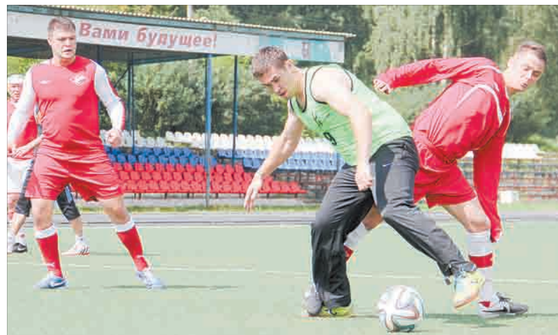
Борьба за мяч в игре «Спартак» – «Вакум».