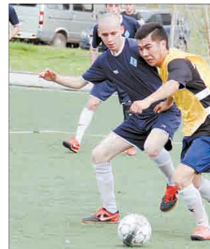
Матч «БазаЧBROZEX» – «Арсенал». «Военные» победили со счётом