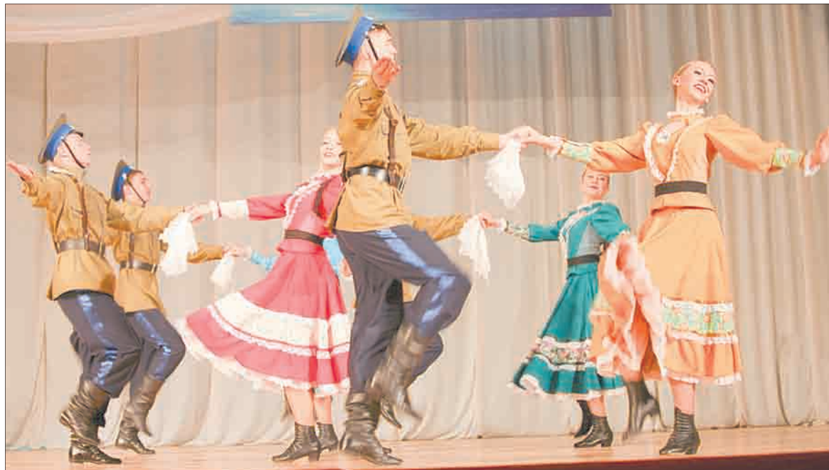
«Казачья плясовая» – один из танцев, исполненных ансамблем «Юность» на международном фестивале.

Так крымчане и участники конкурса познакомились