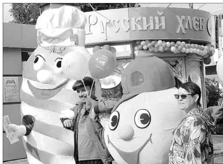
В день открытия нового киоска «Русский Хлеб» березовчан за покупками завлекали ростовые куклы

Новая торговая точка динамично развивающейся компании распола3 гается на бойком пятачке, возле су3 пермаркета «Кировского». Ещё на3 кануне открытия в киоск то и дело заглядывали прохожие с вопросом: «Когда же, наконец, можно будет здесь что3нибудь купить?». Первый день работы показал, что место для торговли выбрано удачно – с само3 го утра, как только открылись двери павильона, сюда начали заходить