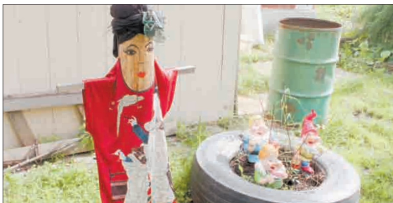
Китайский халатик, импровизированный пучок на голове, — и вот сад обрел новую жительницу — симпатичную японку.