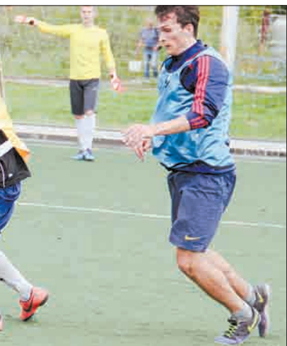
л министерства обороны РФ». 5:2.