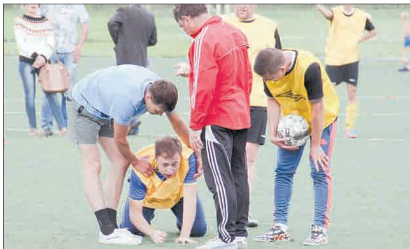
В одном из игровых моментов игрок «Базы» жёстко столкнулся с соперником.