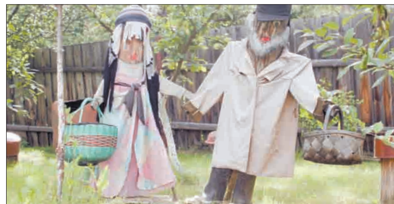
Симпатичную парочку, отправившуюся в лес по грибы, Ирина Чеснокова сделала из брёвен и старой одежды.

менами оказывался практически пустым. Приобретение такого «кота в мешке» для садоводов — не редкость.