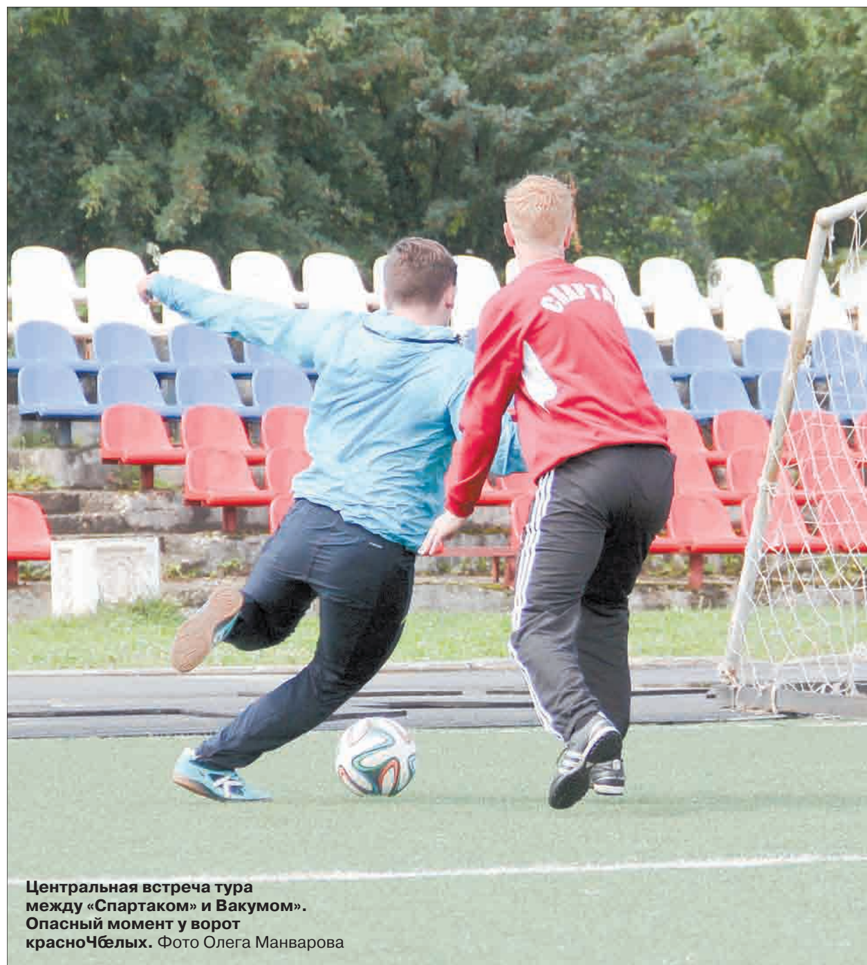
Центральная встреча тура между «Спартаком» и Вакумом». Опасный момент у ворот красноЧбелых.