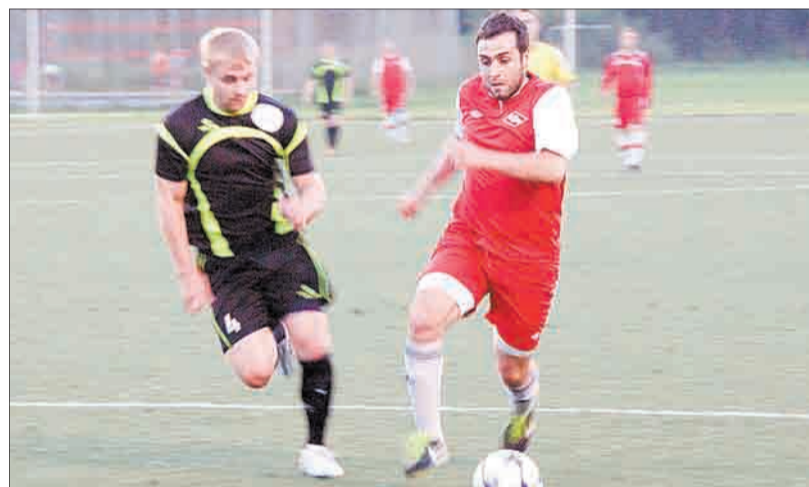
Игровой момент в матче «Спартак» (Берёзовский) – «Стрелец».