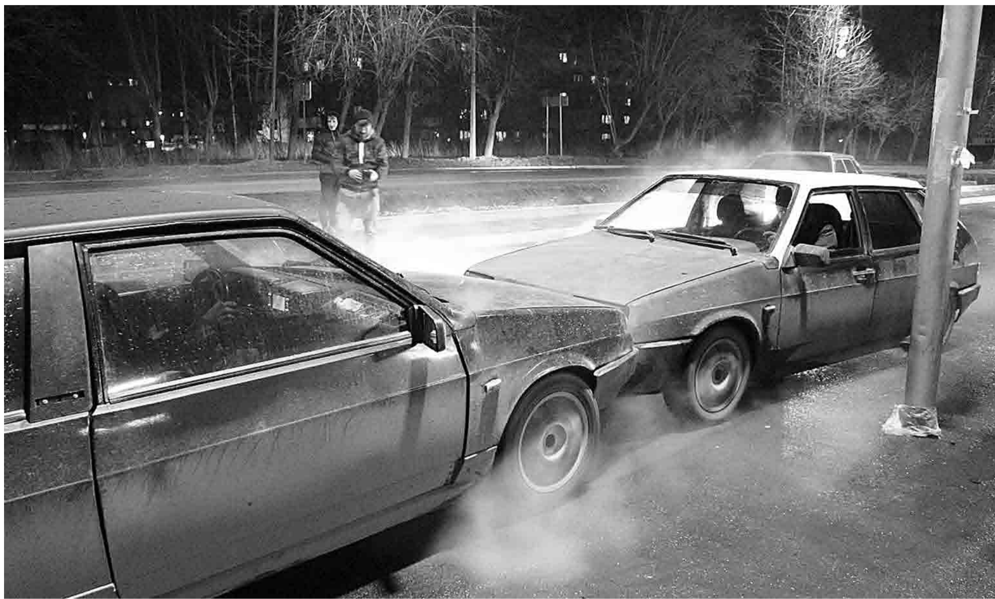
Ночные развлечения молодых автомобилистов на парковке у торгового центра «Центральный» (магазин «Райт»). Помимо дрифта, когда авто движется в управ- ляемом заносе, местные дрифтеры на городских площадках развлекаются так называемым бёрнаутом – жжением резины покрышек на авто, путем пробук- совки колес, стоя на одном месте.