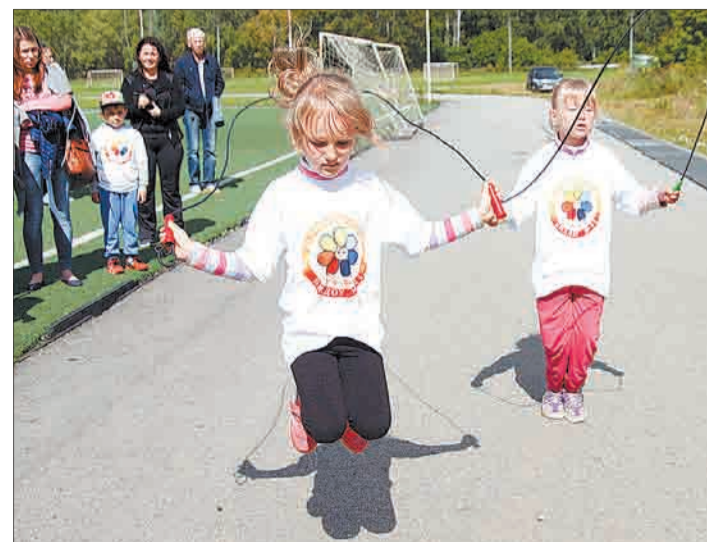
Девочки из команды 41-го детского сада на этапе прыжков через скакалку.