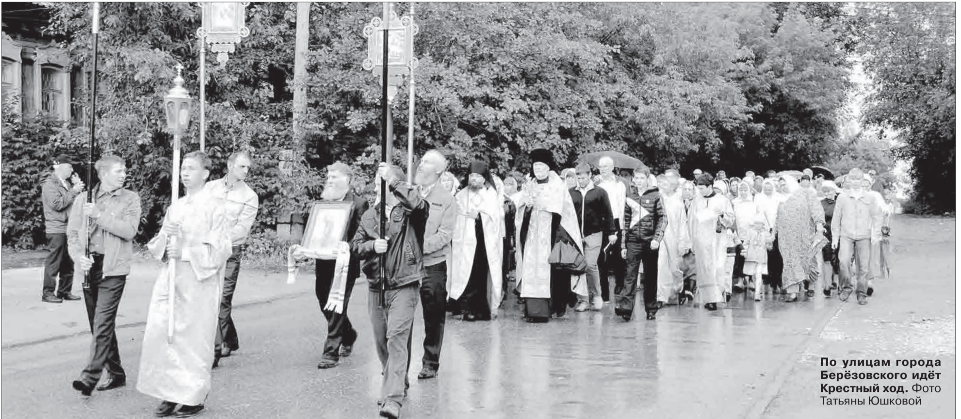
По улицам города Берёзовского идёт Крестный ход.

Тел. журналистов: (34369) 4-53-95, 8-904-982-33-11