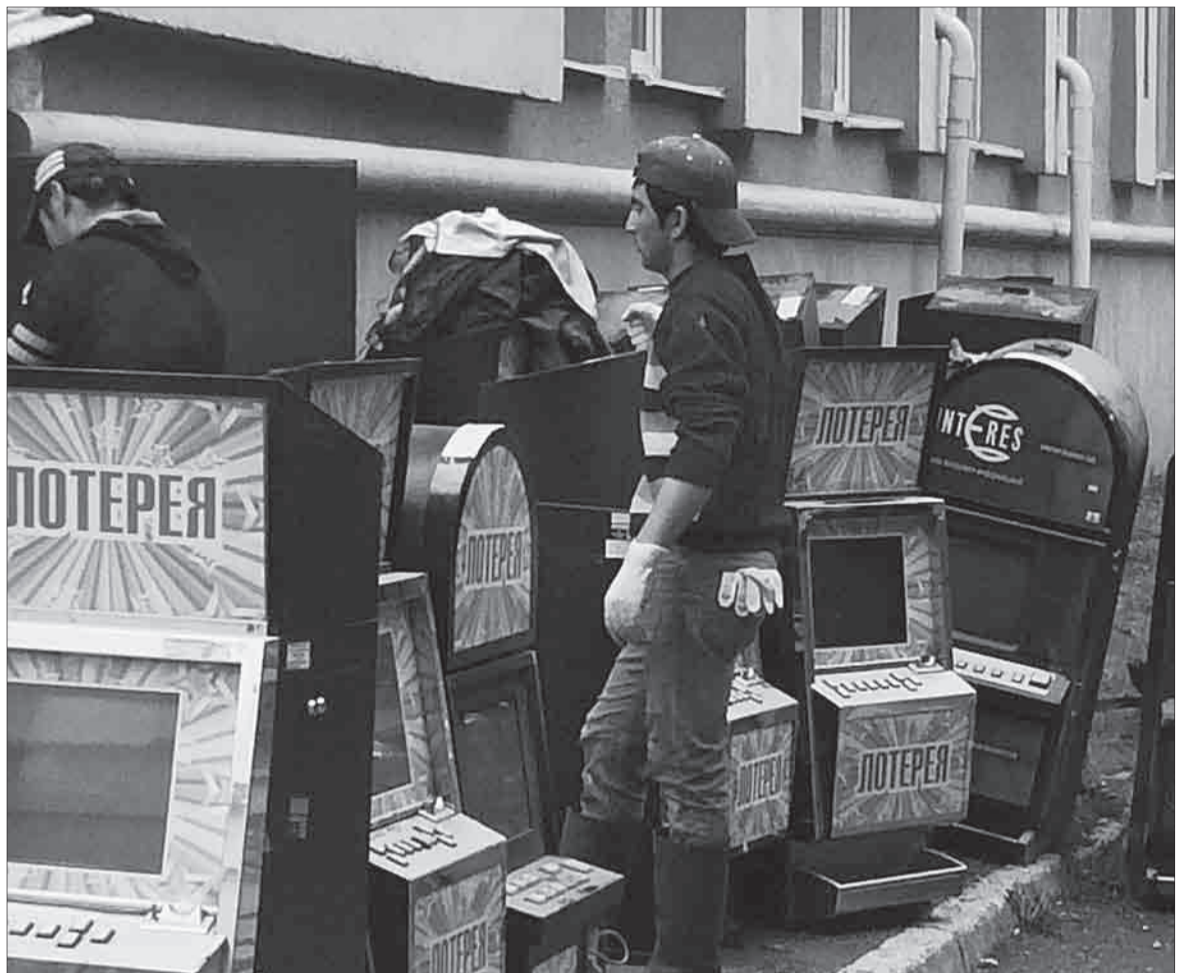
Прохожие удивленно взирали на то, как из здания городской администрации рабочие выносили многочисленные игровые автоматы.

В отношении 45-летнего гражданина возбуждено уголовное дело о даче взятки сотруднику ГИБДД, находящемуся при исполнении должностных обязанностей. Пытаясь уйти от привлечения к административной ответственности, гражданин передал патрульному полицейскому 2000 руб. Попытка дачи взятки зафиксирована 10 августа на ул. Косых.