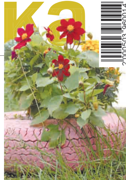
Участники акции «Цветущий гоь род» беззащитны перед вандалами и любителями чужого добра.