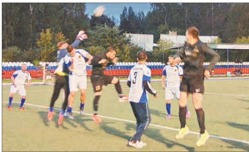
Опасный момент у ворот «Дорстроя».