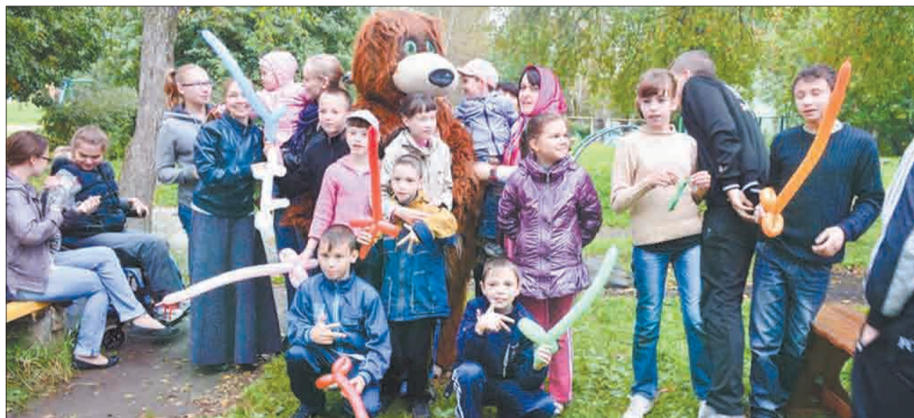
Забавной частью всей развлекательной программы стало творчество: дети с удовольствием делали различные фигурки из длинных воздушных шариков.

Всего за два дня акции «Купи газету – помоги ребенку из детского дома» волонтеры школьники собрали 7500 рублей. Часть денег ушла на настольные игры, наборы по уходу за руками, игрушки – для деток помладше, а также часы, наушники и портативную колонку – для подростков. Подарки были закуплены не просто так, а по заранее собранному списку саппортных детей. Дополнительно к своим заказам им