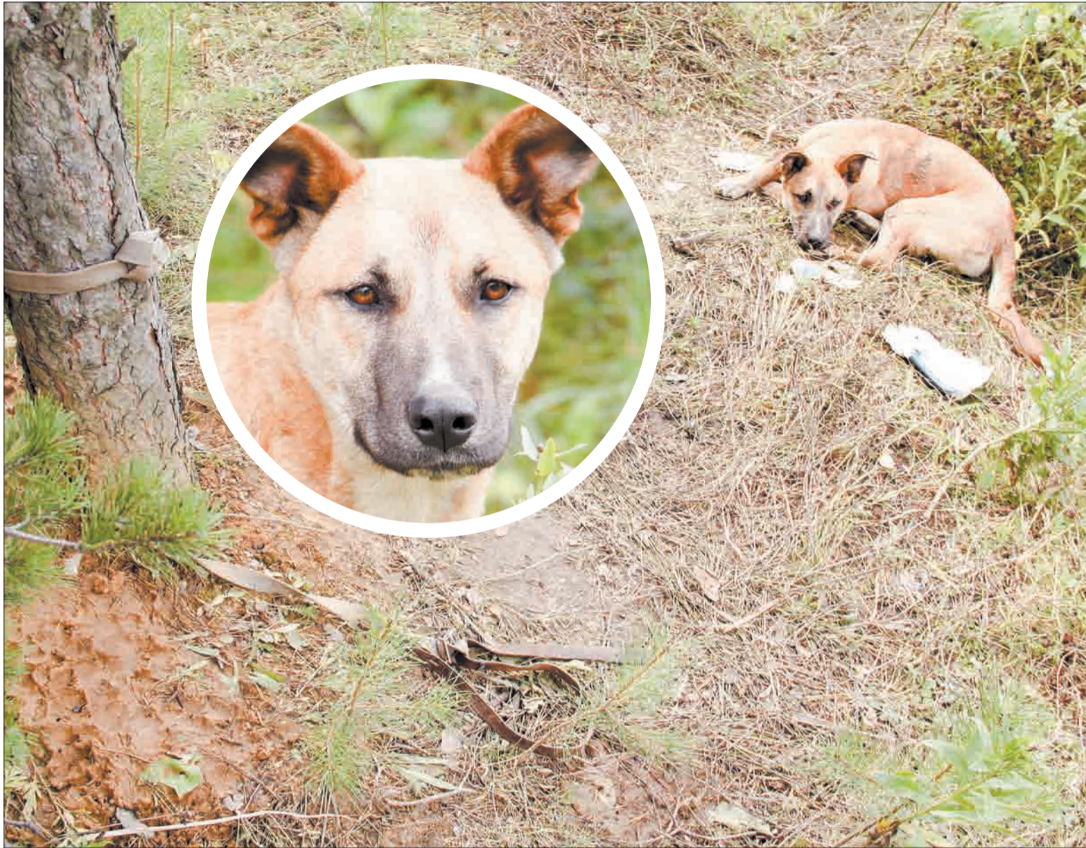
Тот человек, который привязал собаку к дереву, вряд ли подозревал, до какой степени она может быть преданной.