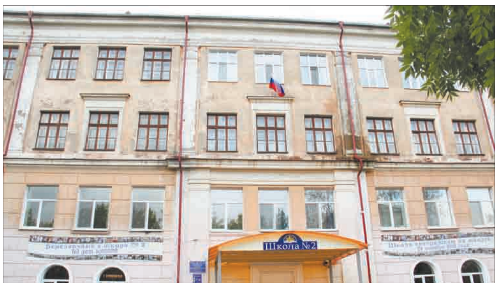
Фасад здания школы № 2 требует ремонта.