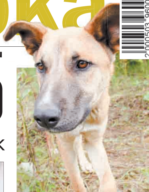
Рыжий пёс две недели прожил у дороги, а затем пропал.