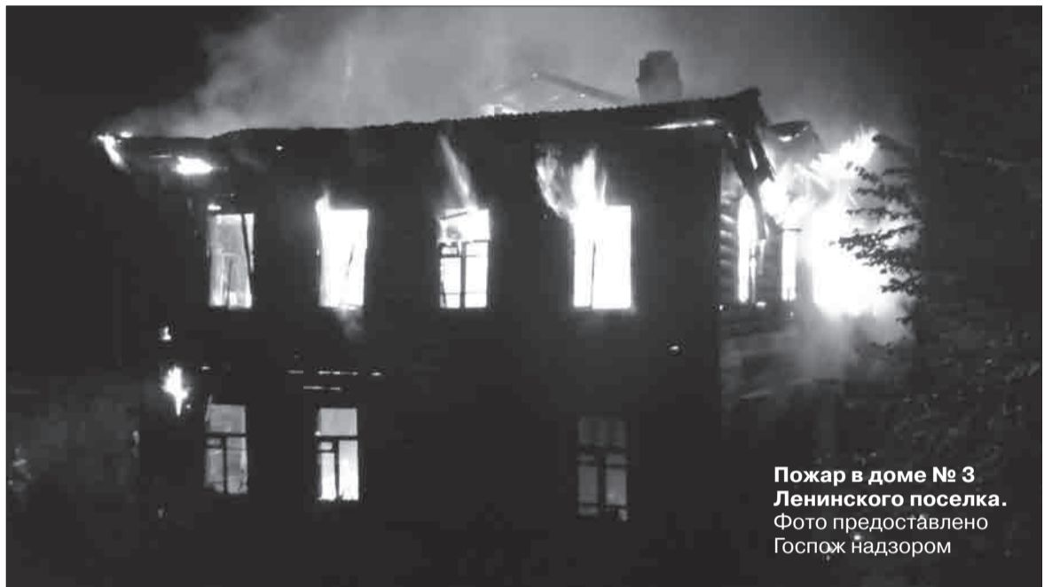
Пожар в доме № 3 Ленинского поселка.