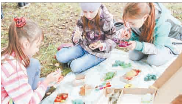
Увлеченные творчеством девчонки, казалось, не замечали ничего вокруг.