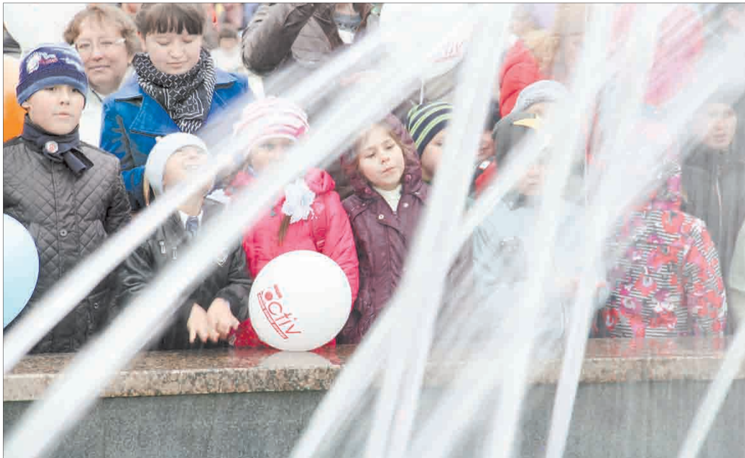
Строители компании «Активстройсервис» приложили немало усилий к тому, чтобы в День знаний на лицах детей и взрослых появились улыбки от разглядывания бьющих в небо струй фонтана.

Фонтан заработал под возгласы первоклашек