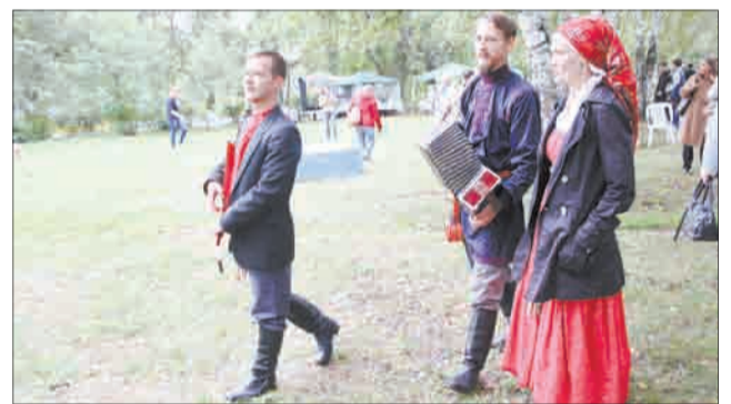
Ансамбль «Поселенцы» исполнил на фестивале старинную русскую музыку Урало-Сибирского региона XVII-XIX веков. Фото Станислава Махова