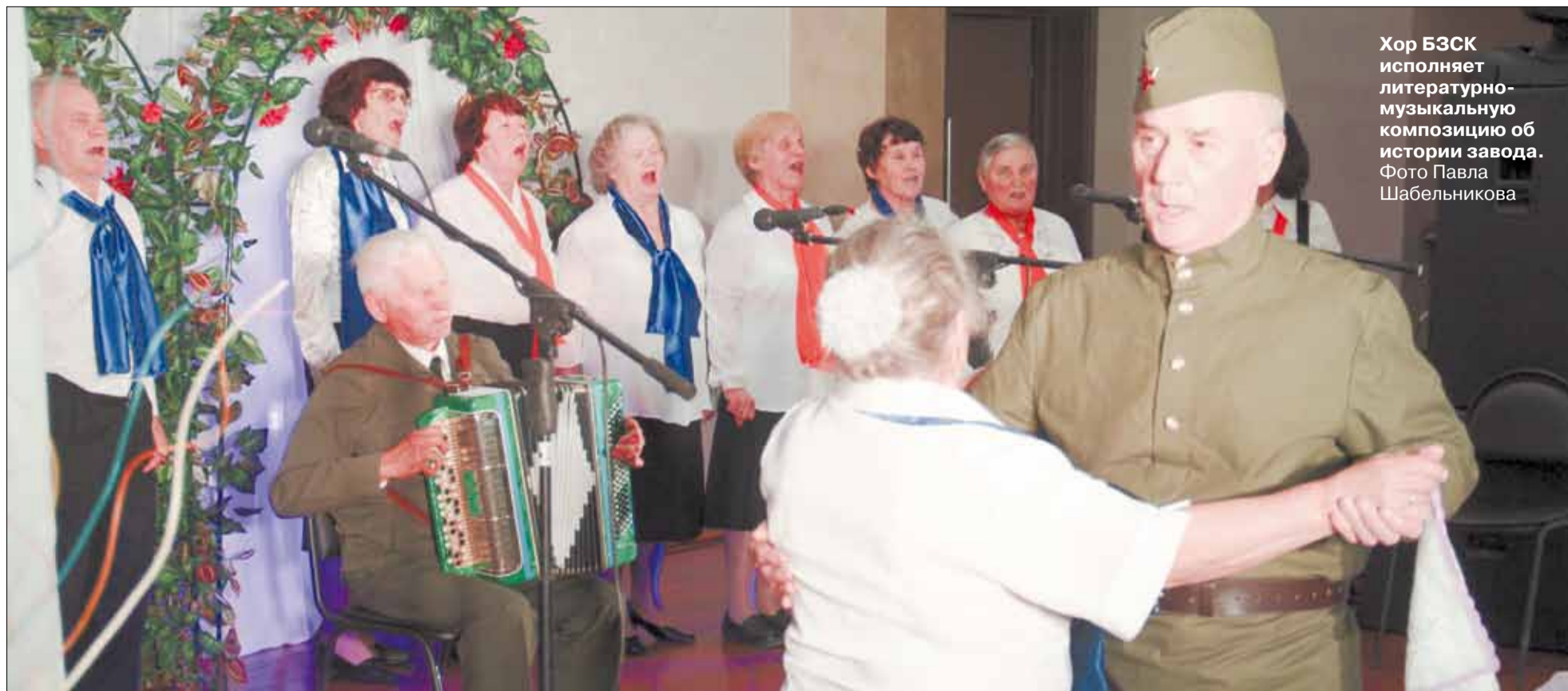
Хор БЗСК исполняет литературно-музыкальную композицию об истории завода.