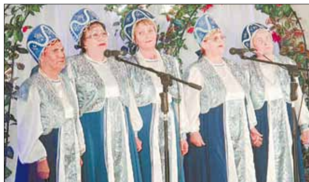
Ансамбль «Горенка» клуба «Играй, гармонь!» городского совета женщин с песней «Спасибо деду за победу»