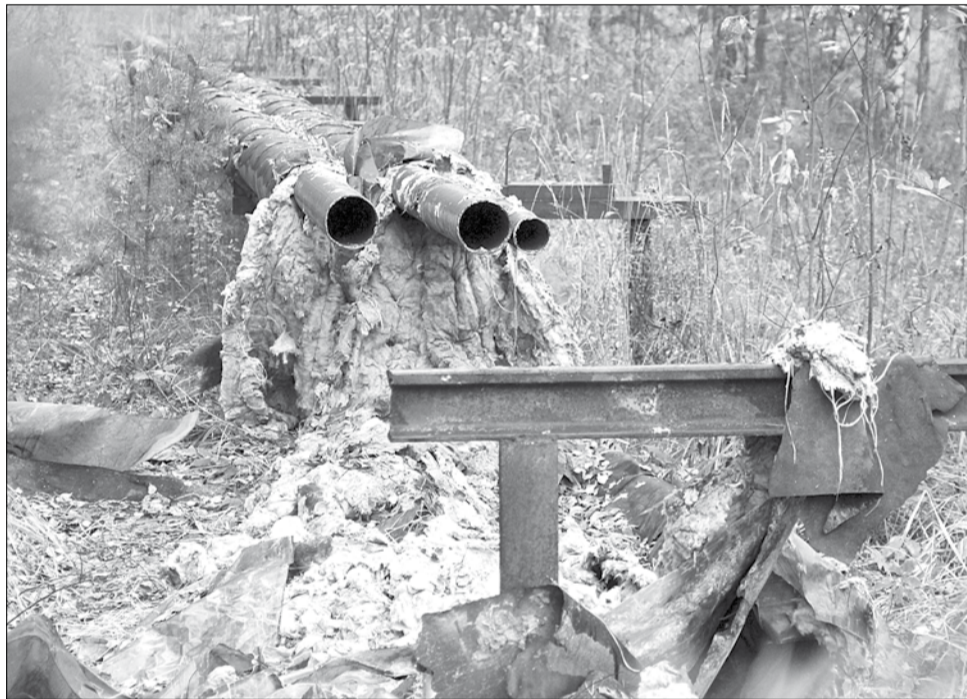
Неизвестные срезали две сотни метров теплотрассы, начиная от ограждения крупного завода, и остановились в лесном массиве. Кроме свежих срезов на протяжении всей трассы имеются следы предыдущих более ранних «демонтажных работ».

надзора предполагают, что причиной вспышки стало нарушение техники безопасности при техническом обслуживании газового оборудования либо статическое электричество.