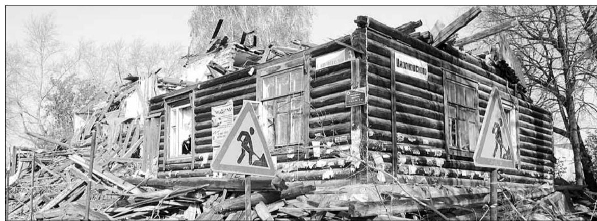
Рабочие ломают последний деревянный барак в центре Берёзовского. На освободившейся земле в районе перекрестка улиц Театральная – Строителей мэр Евгений Писцов обещал возвести в будущем современный дворец культуры.