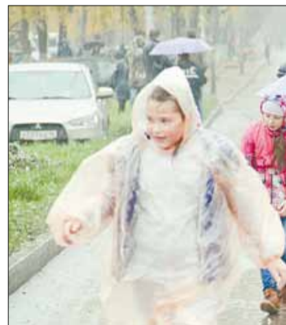
Спасаться от дождя бегунам при помощи зонтов и капюшонов