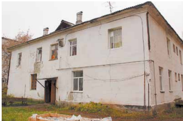
Дом № 1 по ул. Советской в Кедровке. Впереди у подрядчика — ремонт фасада.

Хозяин отмечает, что новые коммуникации будут «шовными», в то время как более надёжными считаются «бесшовные». На этот же нюанс обращают внимание и в управляющей компании «Дом-Сервис», которая обслуживает двухэтажку.