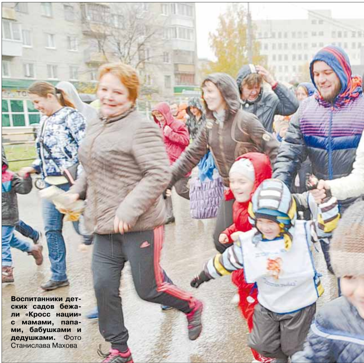
Воспитанники детских садов бежали «Кросс нации» с мамами, папами, бабушками и дедушками.