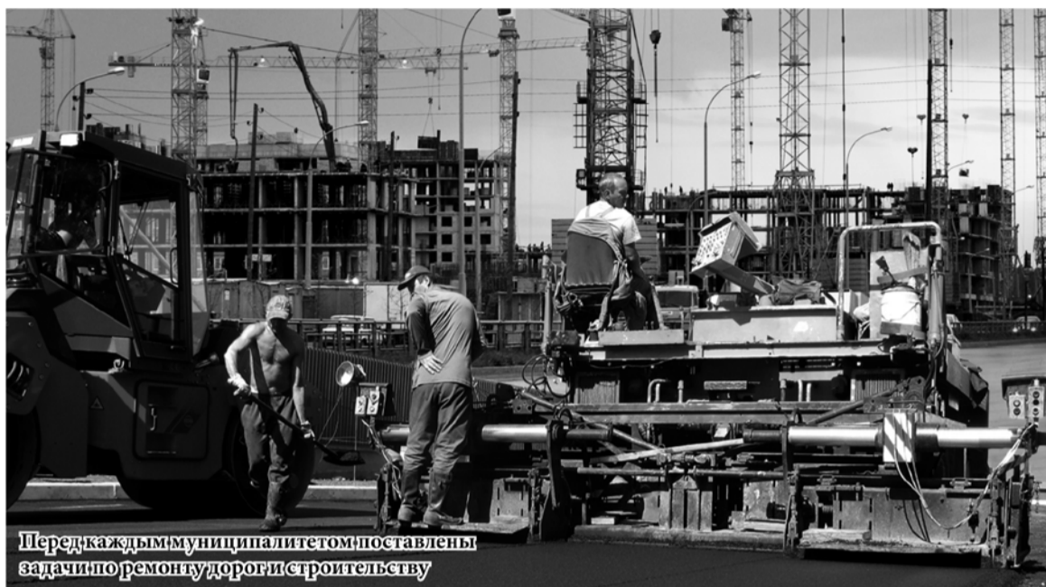
Перед каждым муниципалитетом поставлены задачи по ремонту дорог и строительству

«Это значит, что снижение доходного прогноза территорий при балансировке будет компенсировано из областного бюджета субсидиями и дотациями, – отметила министр финансов области Галина Кулаченко. – Кроме того, не совсем корректно сравнивать общую сумму заявленной потребности муниципалитетов с итоговой. Ведь еще на старте согласительных процедур мы договорились о том, что в сегодняшней экономической ситуации должны быть выделены и обоснованы самые основные проблемы, требующие дополнительного финансирования».