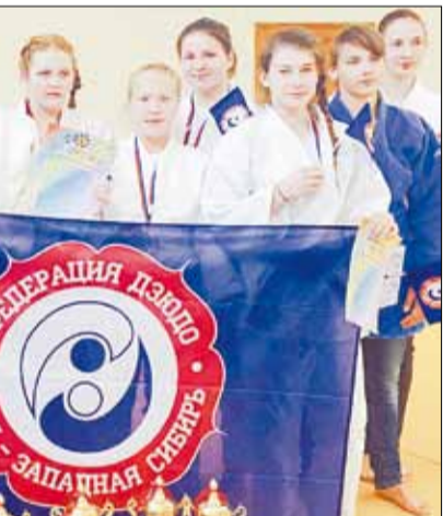
Юношеского округа на Всероссийском турнире памяти Владимира Гмызина