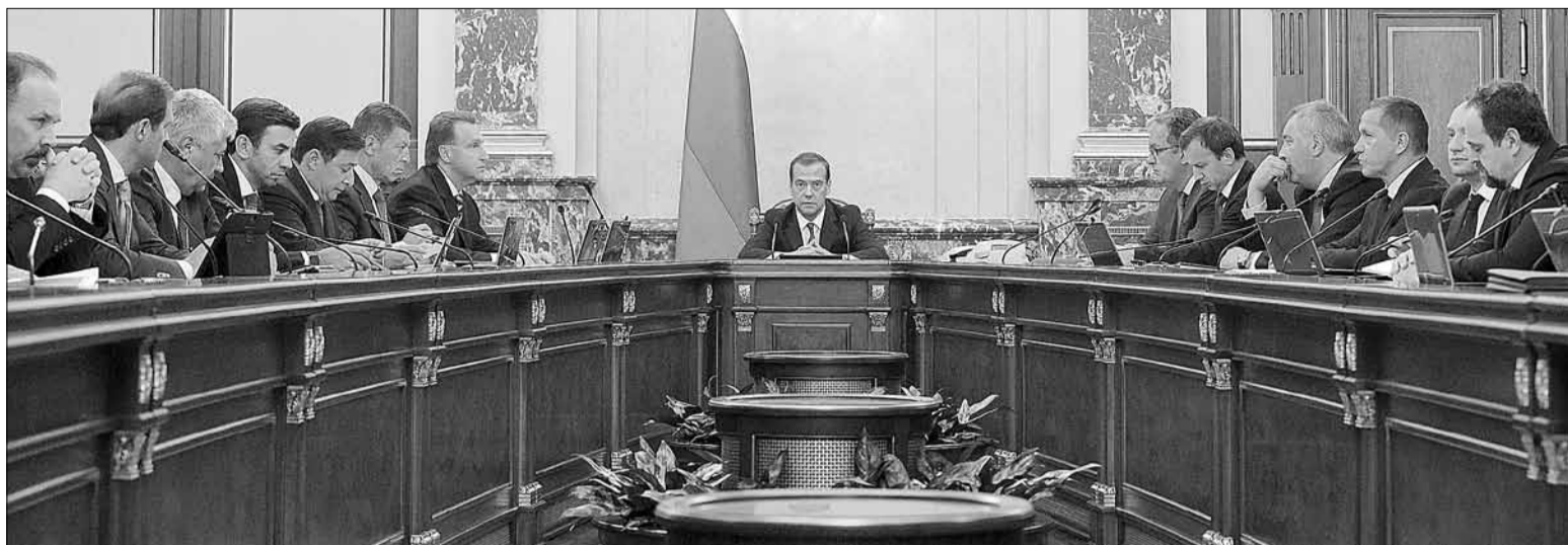
Заседание кабинета министров в Доме правительства РФ под председательством Дмитрия Медведева (в центре).