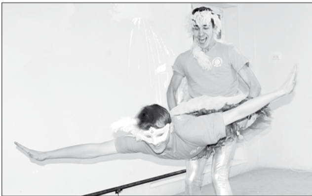
Кто-то к «Минуте славы» подошёл с юмором — у ребят из Серова номер получился хоть и не отработанный, но смешной