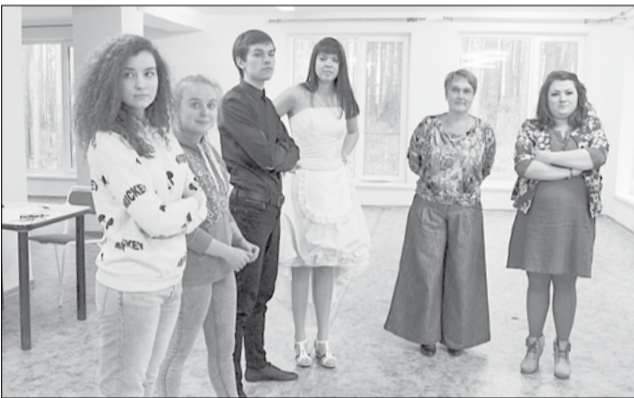
Одним из заданий для очного этапа профессионального конкурса была игра, в которой вожатым помогли группы поддержки соперников