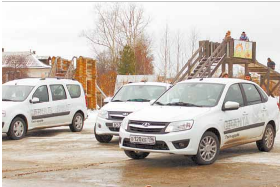
«Берёзовский Лада-Центр» представил на сельский тест-драйв все модели «Лады», которые есть в продаже.