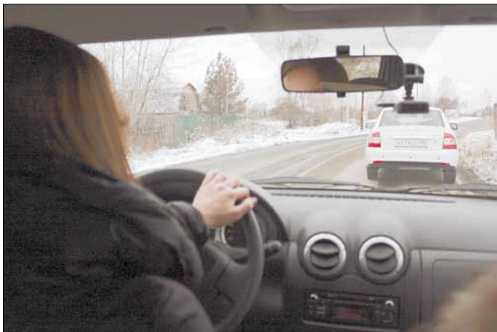
Путь тест-драйва простым не назовешь – от здания администрации до окраины посёлка ведёт дорога, на которой много кочек и крутых поворотов.