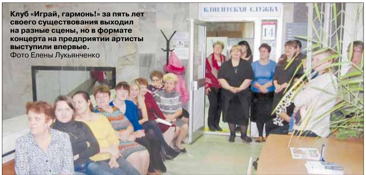
Клуб «Играй, гармонь!» за пять лет своего существования выходил на разные сцены, но в формате концерта на предприятии артисты выступили впервые.

Любовь к родному городу – важный момент в деятельности организации. Чтобы было с чем сравнивать жизнь в Берёзовском, «школьники» решили объездить различные города Свердловской области: посмотреть достопримечательности, побывать у природных памятников, пообщаться с жителями.