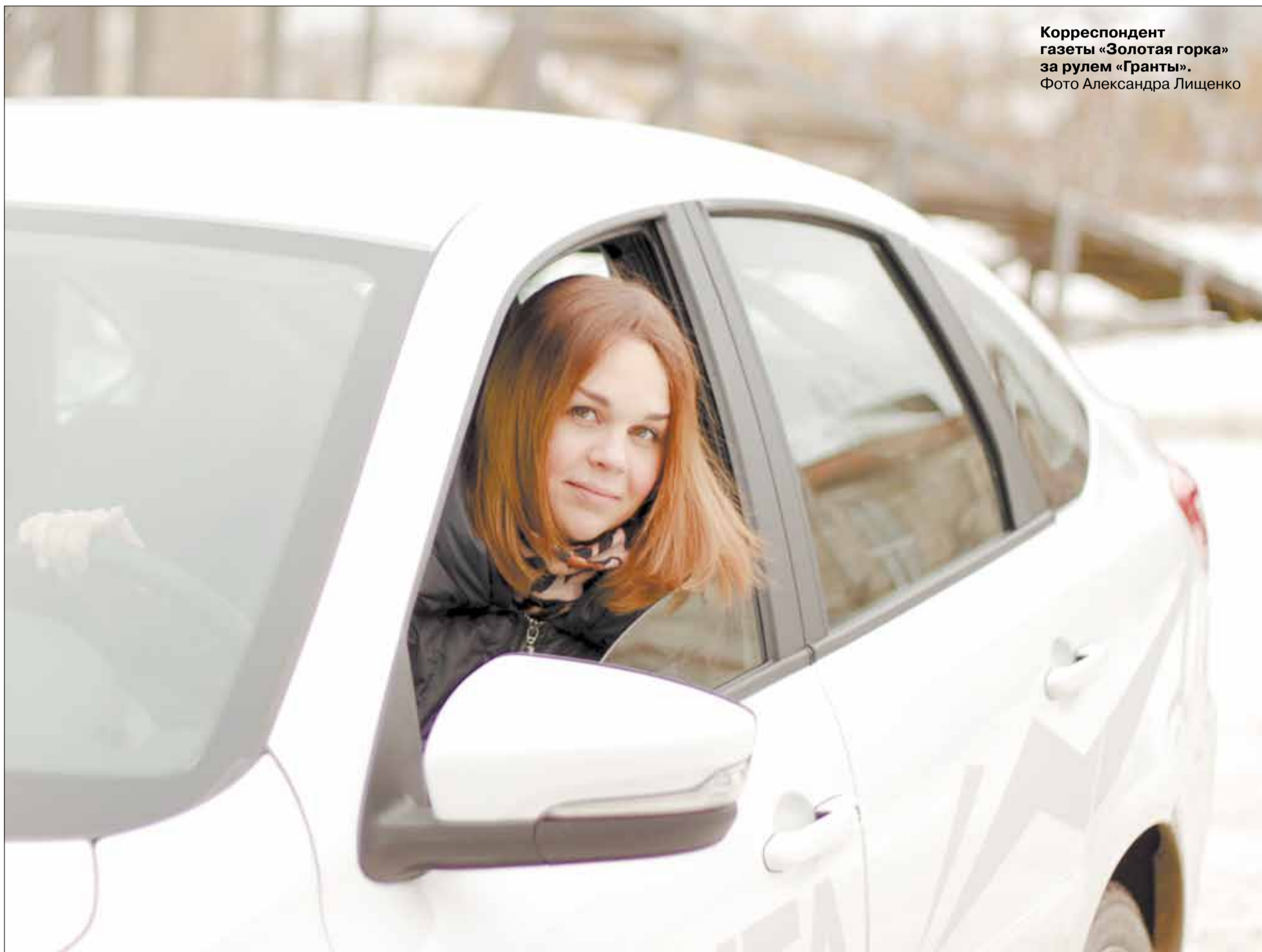
Корреспондент газеты «Золотая горка» за рулем «Гранты».