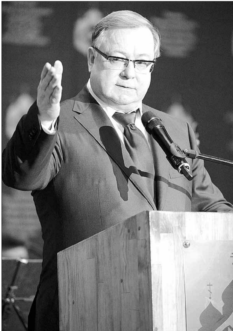
Председатель наблюдательного совета Фонда ЖКХ Сергей Степашин.

Этот вариант решения проблемы ветхого жилья сейчас рассматривает правительство. Решение, я думаю, будет принято в следующем году. Тогда мы и узнаем, по какому пути пойдет переселение из «аварийки». Но то, что программа расселения продолжится и останется