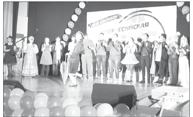
Среди вожатых были две Мэри Поппинс, Пеппи Длинныйчулок, Фиксик, русская девица, академики и многие другие