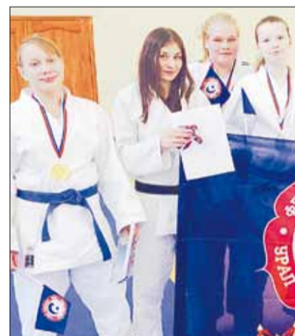
Сборная Уральского федерального округа на турнире по дзюдо, посвященном...