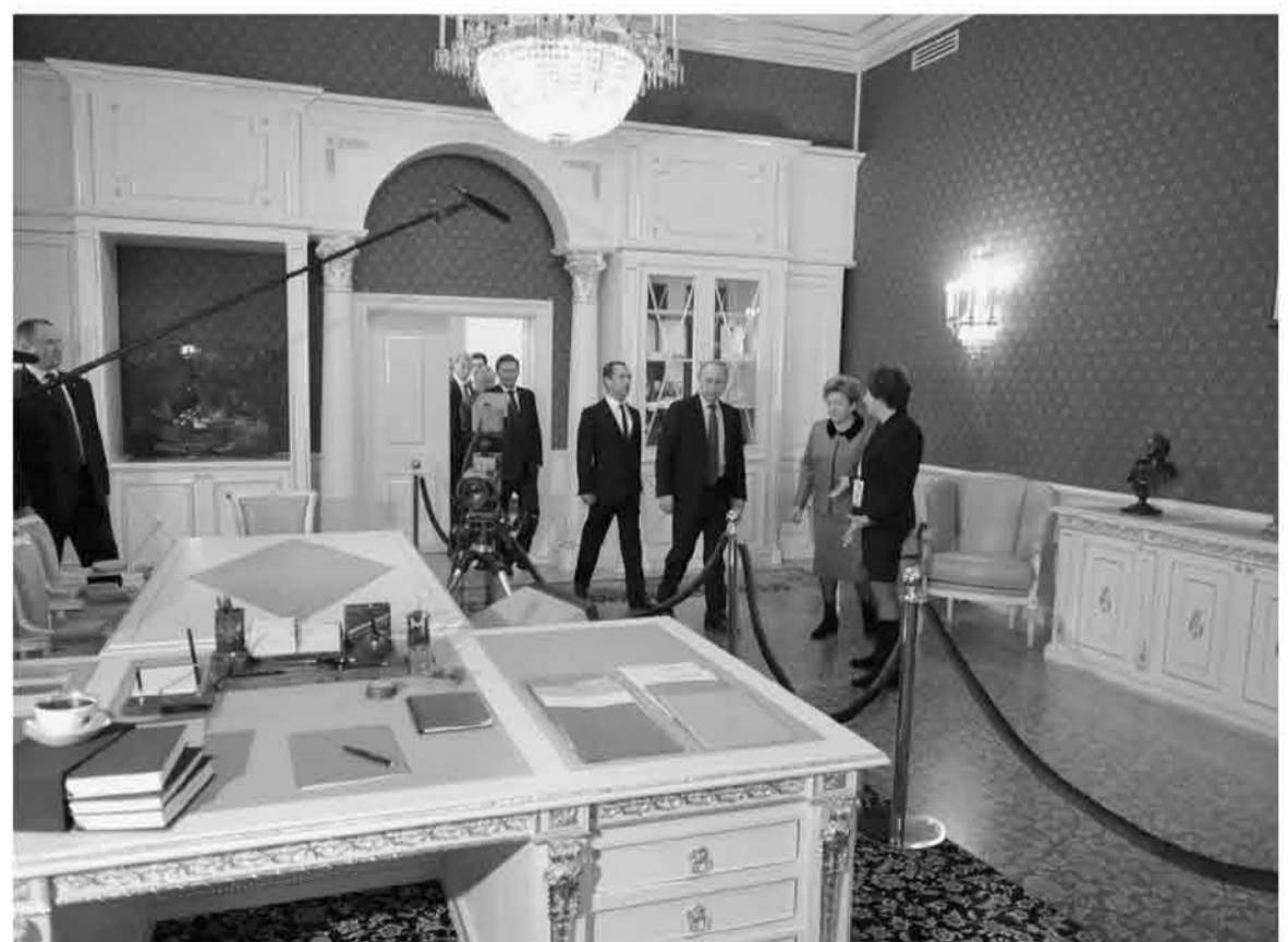
Самый удивительный экспонат – рабочий кабинет первого Президента России, обстановка которого – от письменного стола до штандарта – перенесена из Кремля в музейное пространство.