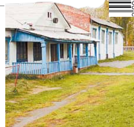
Ветхое здание стадиона поселка Монетного. Власти вложили в населенный пункт 360 миллионов, но решить проблему спортсменов так и не смогли