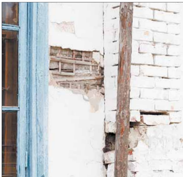
Трещины на фасаде закрытого спортзала.