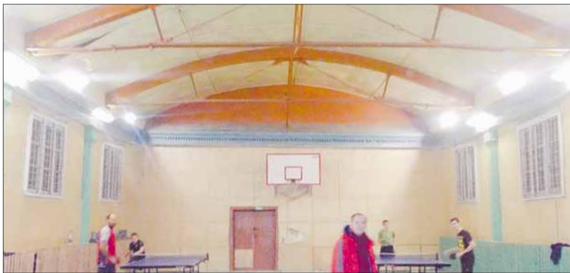
Тренировка по настольному теннису в здании стадиона «Энергия». Ноябрь 2014 года.

После закрытия стадиона секция боевого искусства модернистского переехала в спортзал местной школы № 10. В ноябре здесь прошёл семинар с участием мастера Рене Тонгсона из Филиппин (в первой слева).