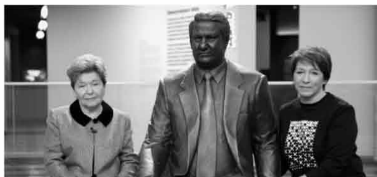
Наина Ельцина и Татьяна Юмашева (дочь): Мы закладываем новую традицию уважительного отношения к президентам, покинувшим свой пост.