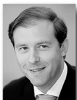
Денис Мантуров, министр промышленности и торговли РФ:

122 тысячи новых рабочих мест. Сейчас возможно увеличить производство импортозамещающей продукции более чем в 2 раза. Для этого мы помогаем предприятиям получить федеральную поддержку».