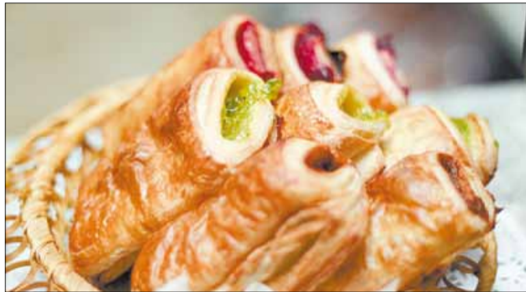
Воздушные слойки с разнообразными начинками ароматно пахнут и выглядят аппетитно, но самое главное — это их вкус.