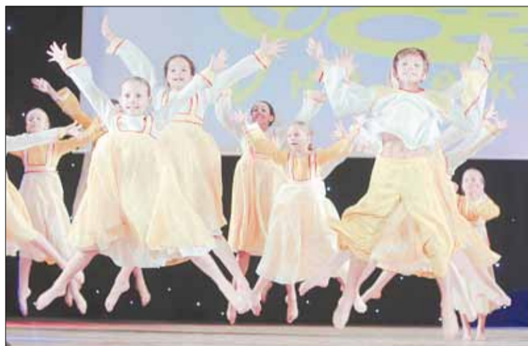
Дебютный номер «Солнце красное» малыши отработали безукоризненно и с задоринкой — благодаря то ли сказкам, то ли профессионализму.

мурашки по коже», когда они наблюдали за выступлением своих преемников из зала, подход оказался удачным. А то, что все без исключения артисты «Ассоль», а их на конкурс отправилось 35 человек, стали лауреатами первой степени — показатель результативности такого подхода.