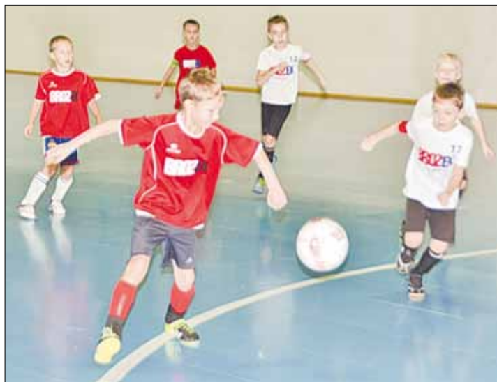
Берёзовское дерби между «BROZEX-2006» и «BROZEX-2007».

Тел. журналистов: (34369) 4-53-95, 8-904-982-33-11