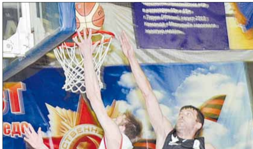
Борьба под кольцом во встрече «BRG-basket» и «Простора».