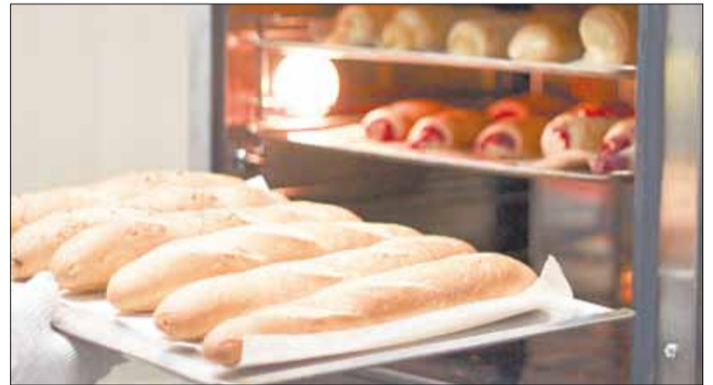
Багеты пекут сами продавцы, на месте. Если продукция не реализуется в тот же день, на прилавке она больше не появится.