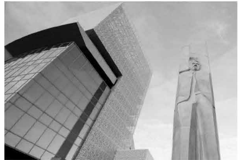
Работы по созданию центра велись с 2011 года. Сейчас это пятиэтажное здание многофункциональной направленности.