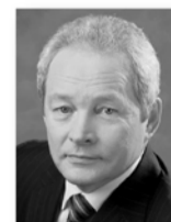
Виктор Басаргин, губернатор Пермского края:

которые находятся в отраслевых госпрограммах. Сформировали механизм возврата средств регионам на развитие промышленной инфраструктуры, на создание индустриальных парков».