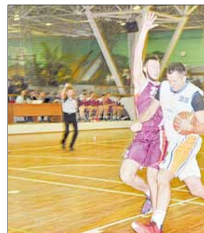
Игровой фрагмент в матче УЭС — «BRG-basket».