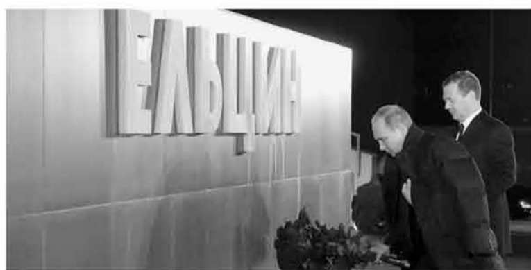
Владимир Путин и Дмитрий Медведев возложили цветы к памятнику первому российскому Президенту.