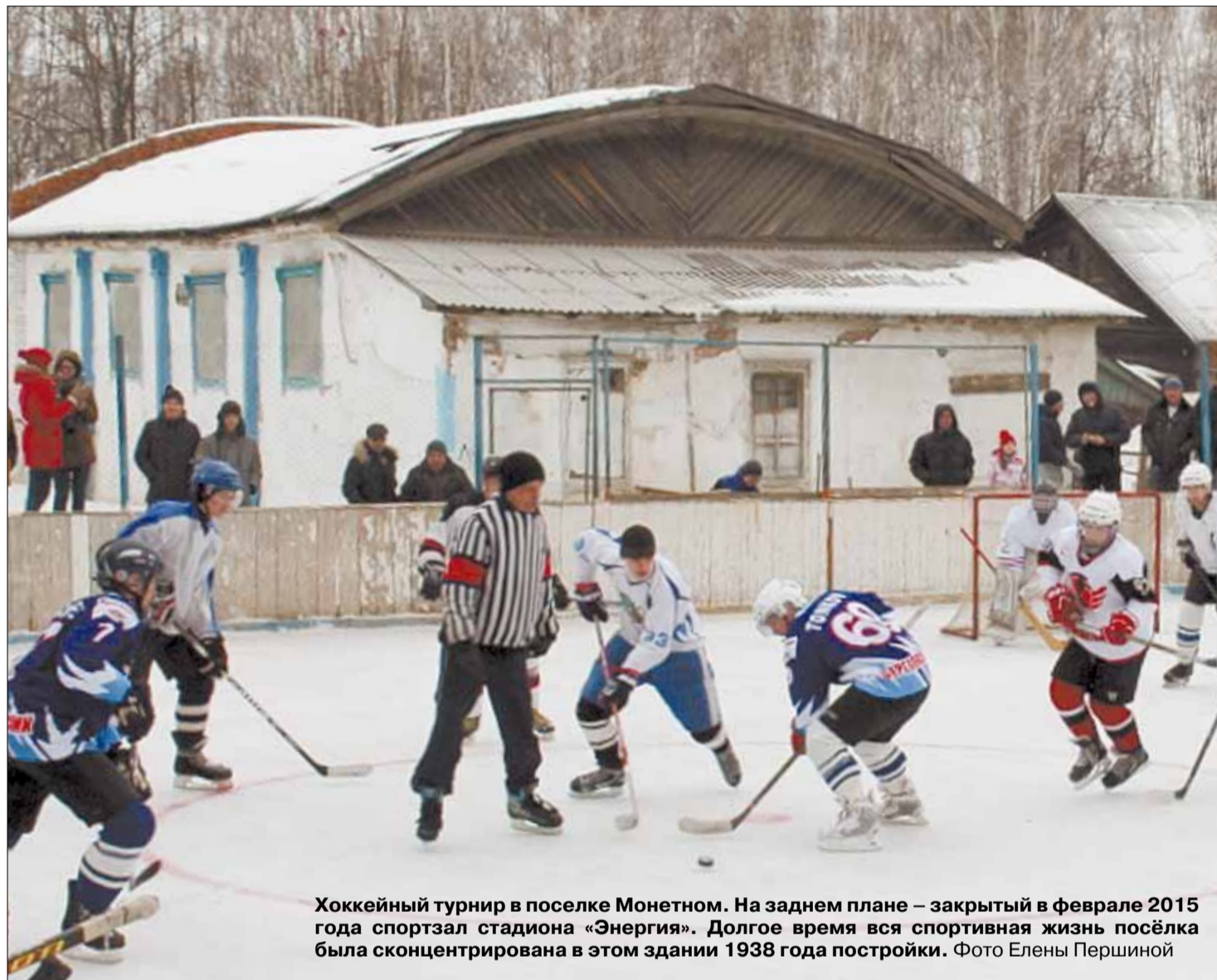
Хоккейный турнир в посёлке Монетном. На заднем плане — закрытый в феврале 2015 года спортзал стадиона «Энергия». Долгое время вся спортивная жизнь посёлка была сконцентрирована в этом здании 1938 года постройки.

Мы собрали 2073 подписи жителей в поддержку строительства в нашем посёлке спорткомплекса.