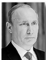
Владимир Путин, Президент РФ:

«Для развития технологической базы и роста промышленного производства в масштабах всей страны мы сформулировали программу импортозамещения.