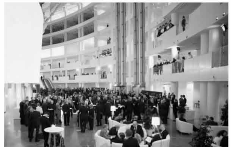
В центре будет библиотека, собрание архивных документов и площадка для открытых мероприятий, конференций, встреч.