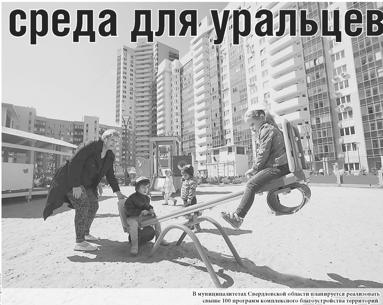
В муниципалитетах Свердловской области планируется реализовать свыше 100 программ комплексного благоустройства территорий.

● Проект рассчитан до 2021 года и будет осуществляться за счёт нескольких источников финансирования – областного, федерального и местного бюджетов, а в случае с благоустройством дворов – частичным участием средств собственников домов.