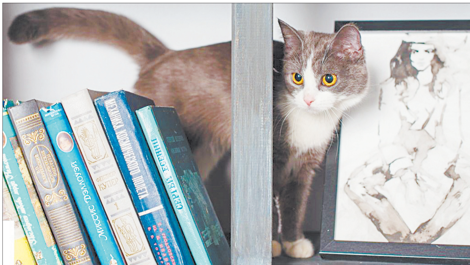
Кошка Алиса, возраст 8 месяцев, передержка «Cat»