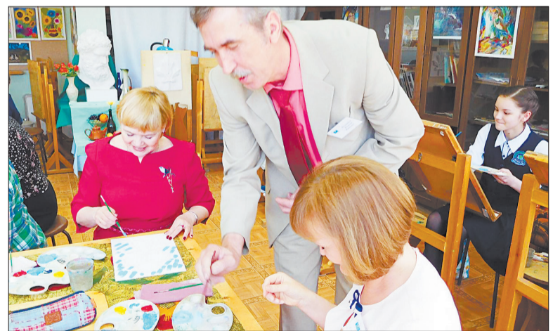
Василий Иванович учит не только детей, но и проводит мастер-классы для педагогов города

бурга (стоимость работ варьируется в пределах 20—30 тысяч), проведение мастер-класса для педагогов города — жизнь Наливайко отдана искусству практически целиком.