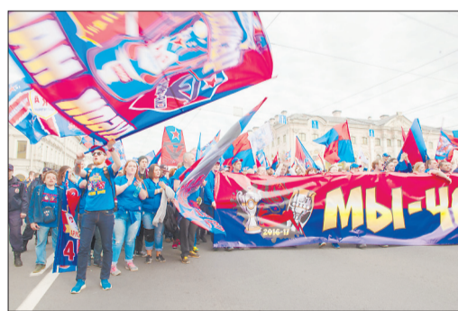
Мощной волной прошли по Невскому проспекту фанаты питерского хоккейного клуба СКА. Березовчане увидели такую толпу болельщиков впервые