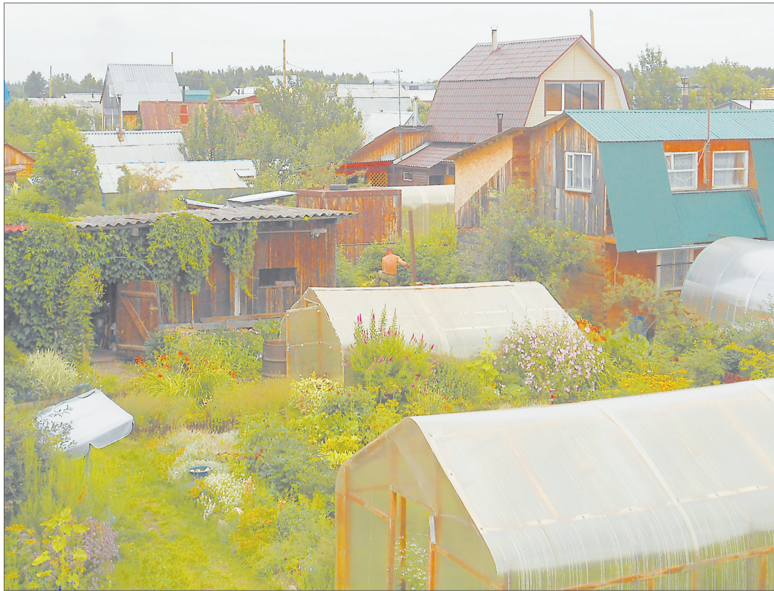
Принятие нового закона вряд ли облегчит жизнь 60 млн российских садоводов: денег на создание инфраструктуры для них по-прежнему нет.

Законопроект позволяет гражданам ведение садоводства и огородничества без образования юридического лица, но в нем прописаны полномочия некоммерческих организаций, создаваемых для ведения садоводства, огородничества и дачного хозяй-