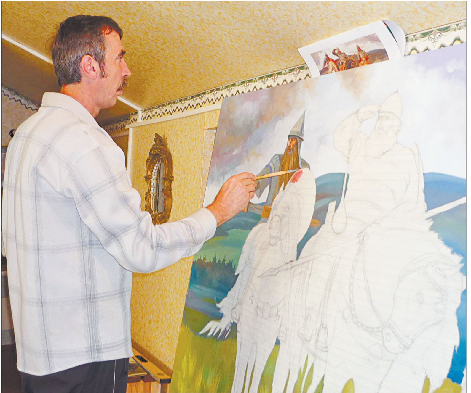
Художник пишет картину. Копия «Трёх богатырей» Васнецова украшает сегодня одну из стен школы № 9

Дистанционные курсы и курсы повышения квалификации, выставочная деятельность в картинных галереях Екатерин-