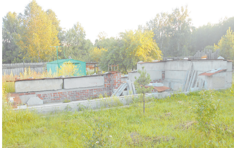
Для «жилого дома» в саду теперь потребуется проект

ства, их ответственность. Для удобства голосования вводится очно-заочная и заочная формы проведения общих собраний членов товарищества.