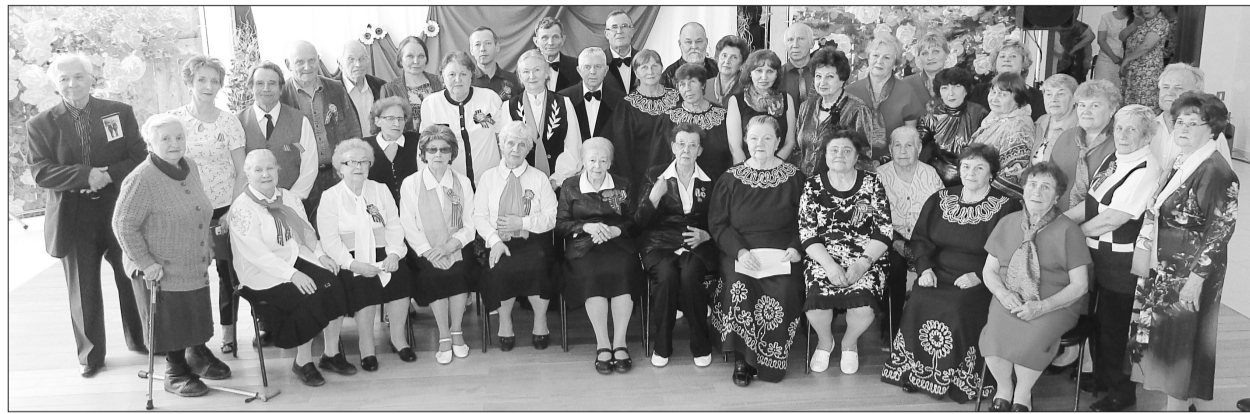
Совет ветеранов Новоберёзовского микрорайона, гости и участники концертной программы