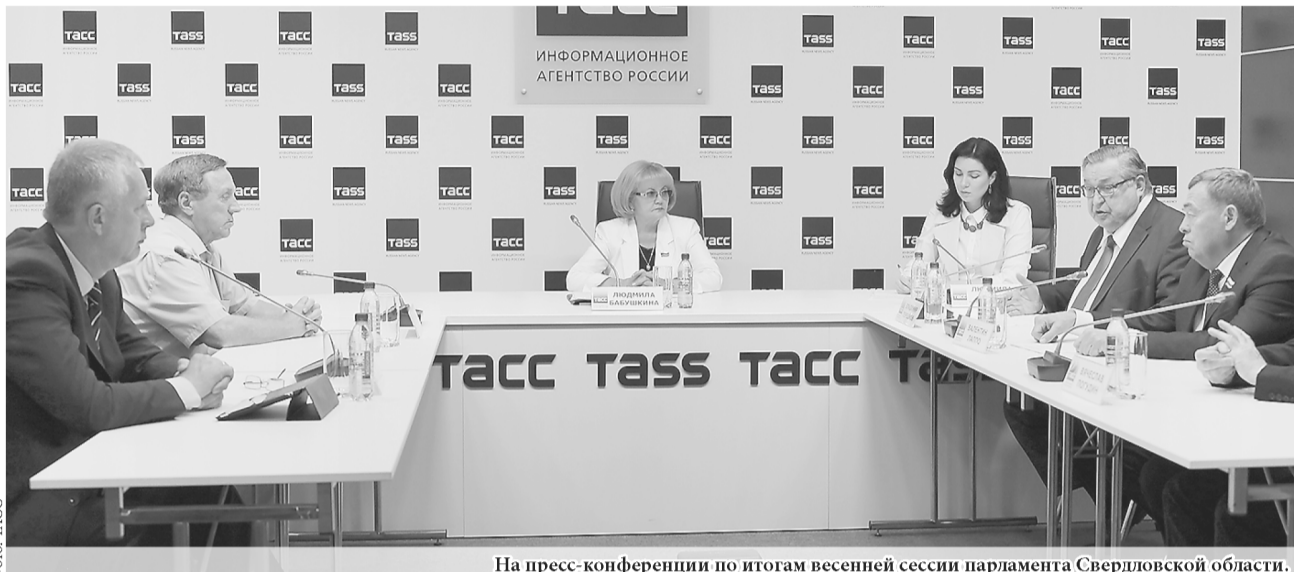
На пресс-конференции по итогам весенней сессии парламента Свердловской области.

Отметим, перерыв в заседаниях парламента не означает длительный отпуск депутатов: до 26 сентября будут проходить комиссии, депутатские слушания по законопроектам, которые планируются к рассмотрению в осенней сессии. Депутаты получат возможность больше работать в своих избирательных округах.