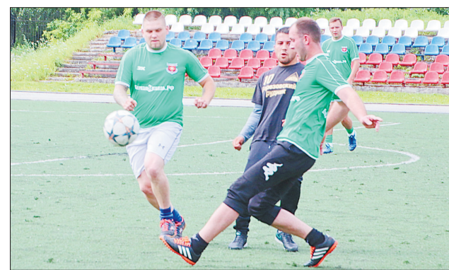
Игровой момент в матче команд «Горняк» и «Арсенал министерства обороны».

лые подачи, но чуть удачливее оказалась команда Шиловки — 16:14. Матч изрядно измотал как победителей, так и игроков из Монетного. В результате в борьбе за первое место сражались команды Кедровки и... Шиловки. В борьбе за третье место команда из Лосиногского взяла верх над спортсменами из Сарапулки. Это был 4-й вид спартакиады. Таблицу общего зачета возглавляет Лосиный, на втором месте — Монетный.