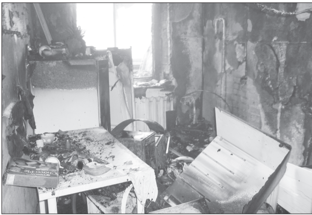
Сгоревшая кухня в многоэтажке.

Рекламная служба: (343) 247-83-34, ул. Восточная, 3а-504