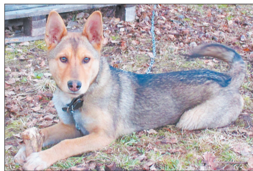
Щенок Тая, 4 месяца, Волонтерское движение «Подари свою Доброту»