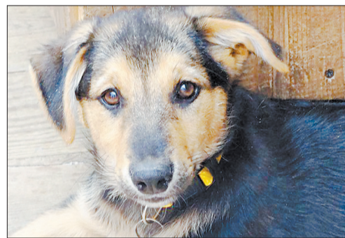
Щенок Юкка, 9 месяцев, общественная организация «Волонтерская почта»