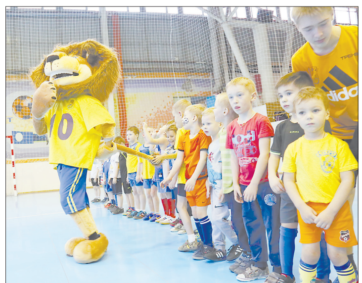
Ростовая фигура льва – символ детской футбольной школы – на празднике.