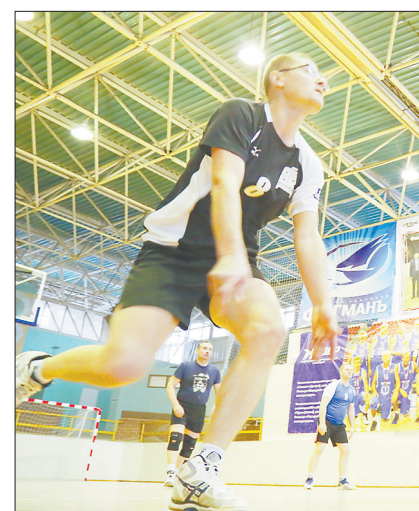
В ходе отборочных матчей команда успешно играла в пятером. Фото