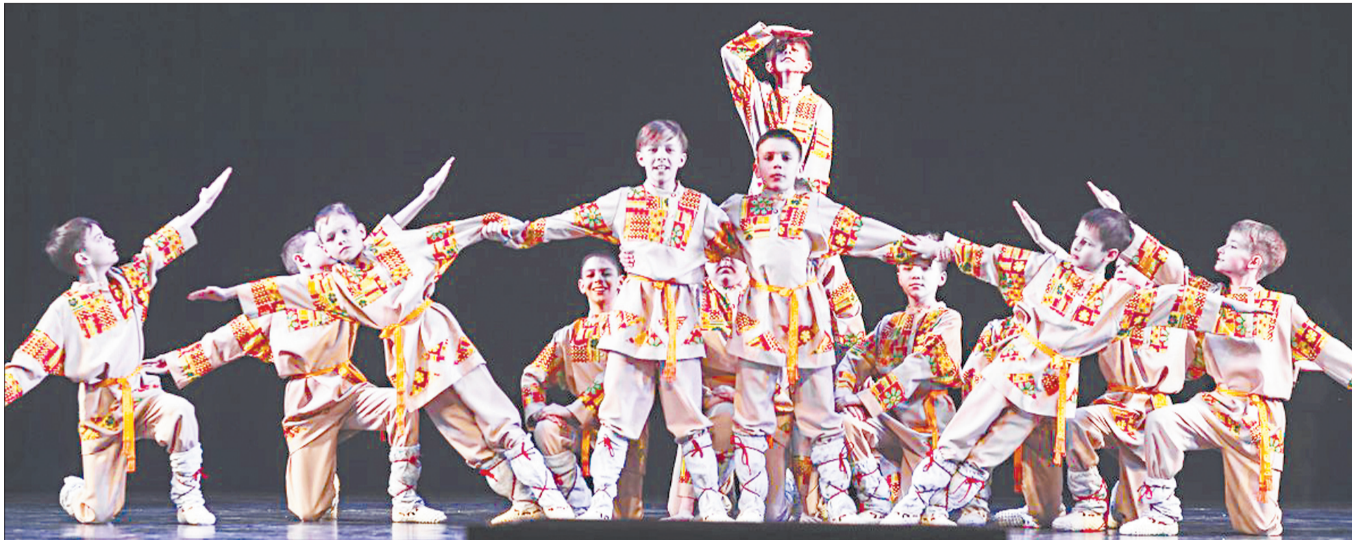
Мужской состав ансамбля с номером «Богатыри».

Берёзовский танцевальный коллектив отпраздновал круглую дату