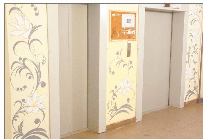
Искусство в таком прозаичном месте, как площадки возле лифтов, не всем пришлось по нраву