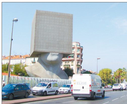
В голове у человека, не поверите — библиотека.