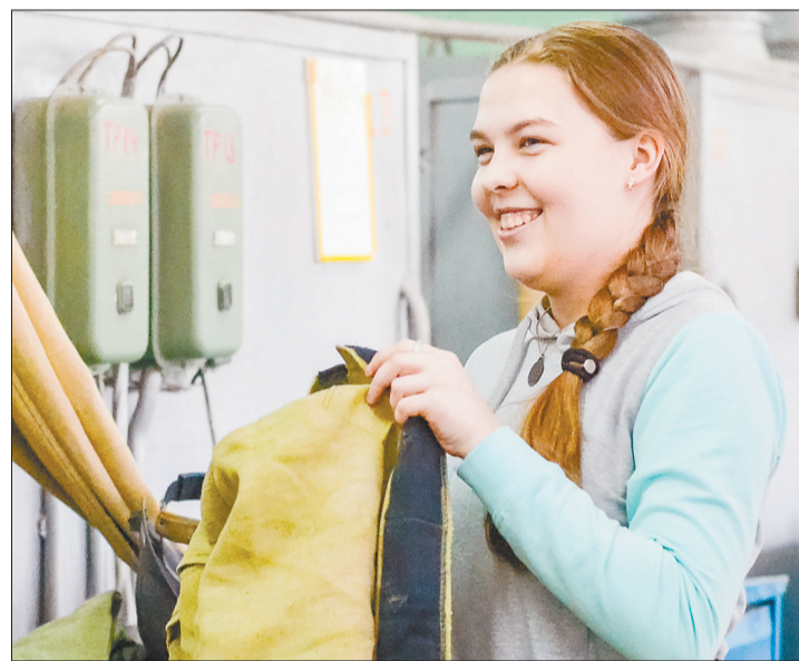
Среди будущих сварщиков и автомехаников немало девушек. Педагоги «Профи» замечают: понятия «мужские» и «женские» профессии сегодня размываются