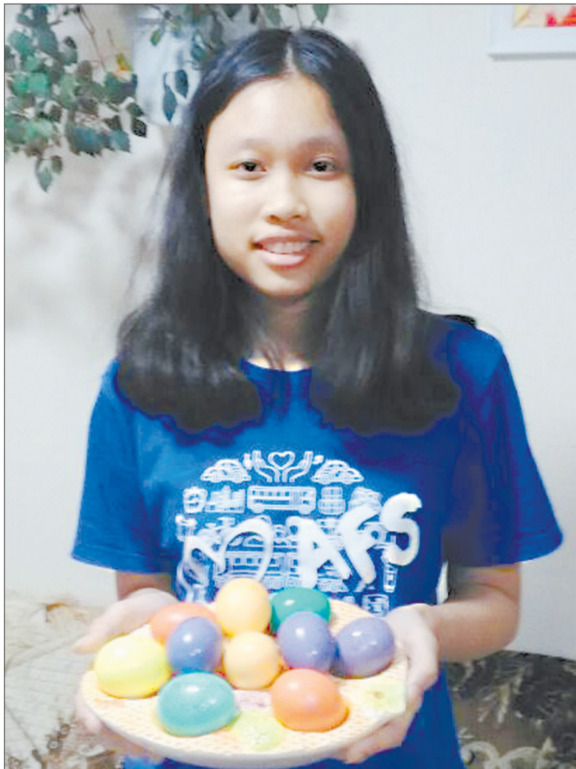
Разрыв шаблонов: тайская школьница и пасхальные яйца. Но больше всего обе девушки в восторге от нашего борща