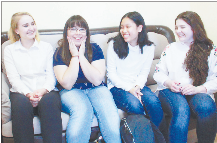
Благодаря дружелюбию и гостеприимству принимающей стороны девушки чувствуют себя комфортно. Они много улыбаются и охотно рассказывают о себе