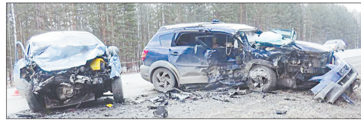
Водитель американского автомобиля стал виновником аварии после выхода на обгон.