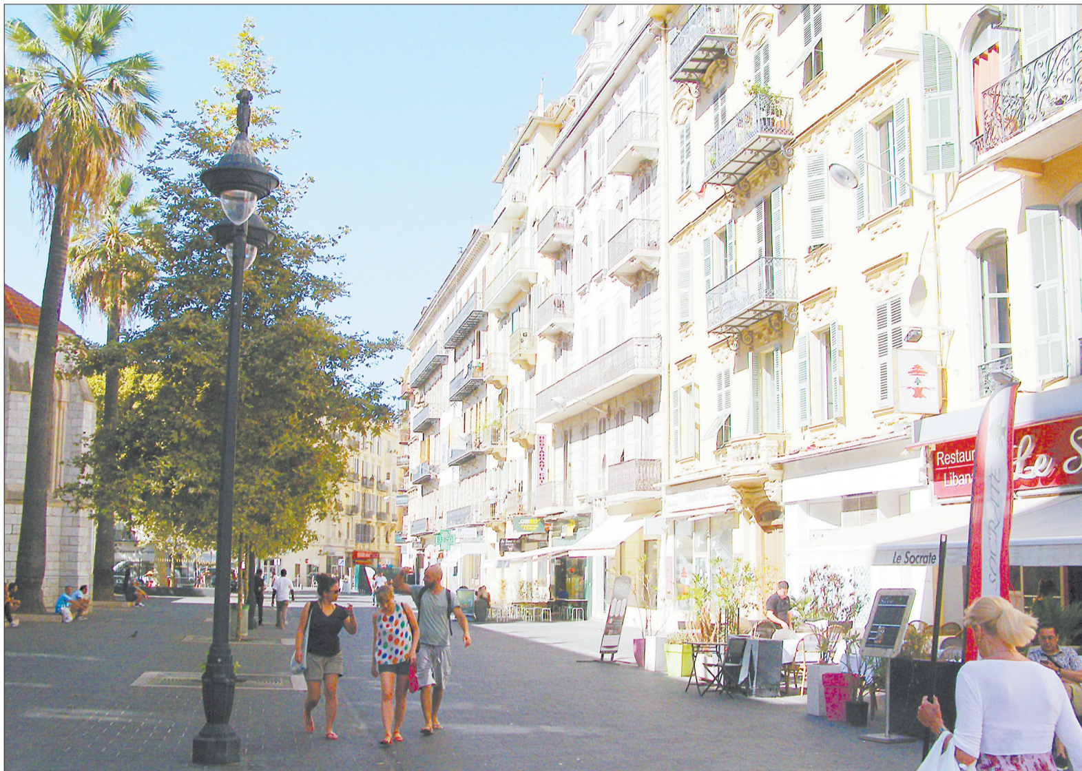
Хостел расположен почти в центре Ниццы, рядом с главной улицей Жан Мадесан.

Утром все кухонно-гостиное пространство, переходящее в ресепшн, было убрано и приведено в порядок, как будто тусовки здесь не было. В умывальнике и туалетах все вечерние лужи и разливы были ликвидированы. И так методично, каждое утро. С вещами проблем не было. В моем распоряжении был решетчатый короб, сваренный из прутка нержавеющей стали, к которому под залог в 5 евро мне выдали замок. Туда помещались чемодан, сумка, еще и место оставалось.