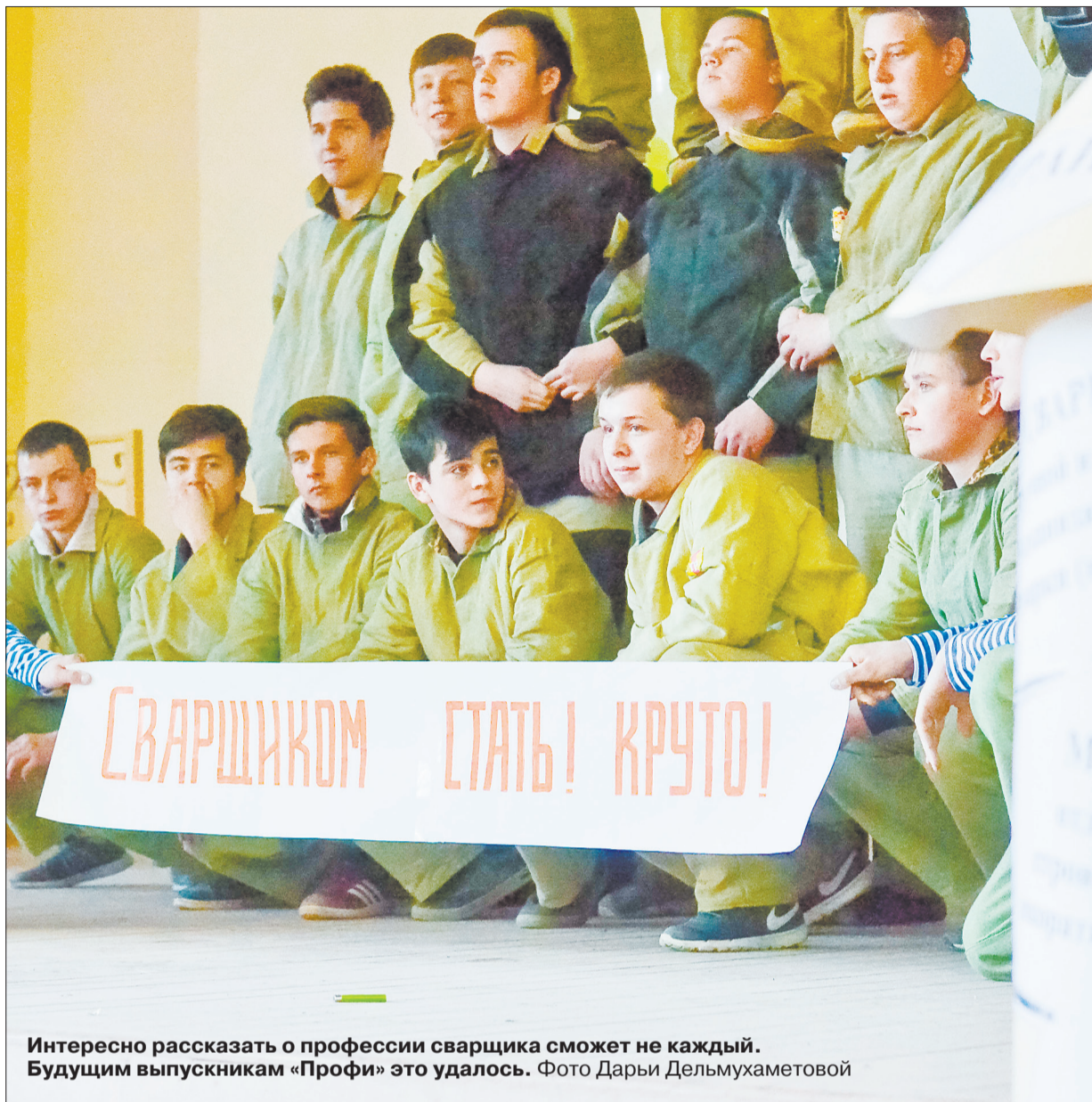
Интересно рассказать о профессии сварщика сможет не каждый. Будущим выпускникам «Профи» это удалось.

Рекламная служба: (343) 247-83-34, ул. Восточная, 3а-504