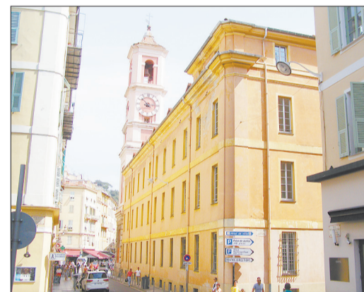
Узкие улочки старой Ниццы.

Когда мне вернули залог в день отъезда, я уже никуда не торопился и отдал 3 евро за завтрак. Ощутил разницу: 4-5 евро стоил кофе с круассаном на вокзале, откуда я отправлялся по своим делам рано утром. А здесь я получил хлопья с молоком, яблочный сок, прекрасный кофе, хлеб, масло, джем.