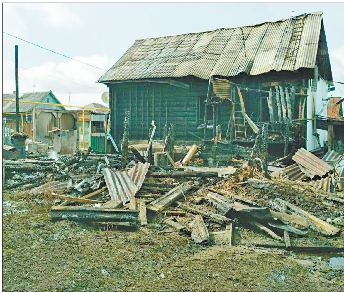
Загоревшаяся баня стала причиной порчи жилища, внутреннего убранства, имущества хозяев домовладения.