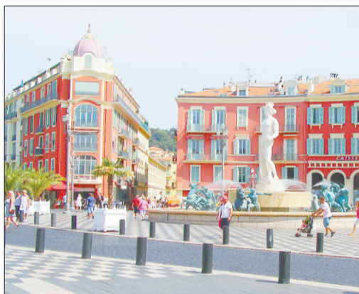
Главное тусовочное место в Ницце — площадь Массена