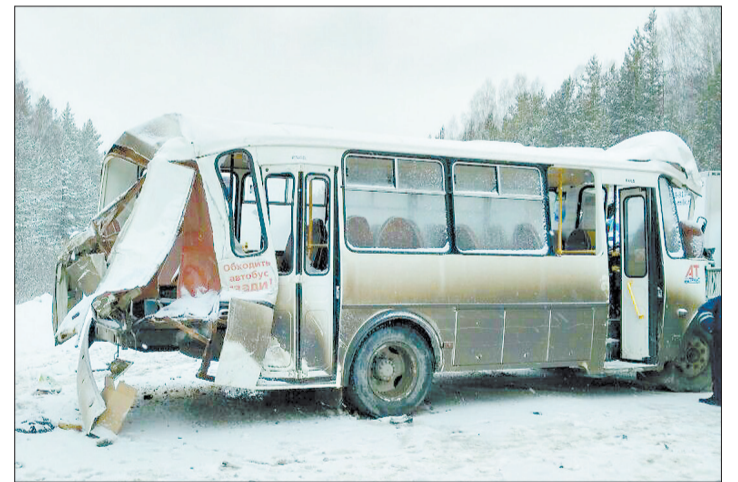
Мартовская авария с автобусом на режевском тракте не должна повториться при перевозке детей в период летних каникул.

Возбуждением уголовного дела по статье уголовного кодекса «Мошенничество в сфере кредитования» обернулась для молодого человека попытка обмануть банк. 3 мая в салоне «Связной» на улице Анучина он предоставил при оформлении кредита на покупку заведомо подложные сведения о месте работы и уровне заработной платы. Таким образом, он попытался обмануть кредитную организацию на сумму 71539 рублей. Однако хитрость не прошла даром — обман быстро вскрылся, и сейчас за попытку обмануть банк на значительную сумму обманщику могут присудить до двух лет исправительных работ или наказать крупным штрафом.