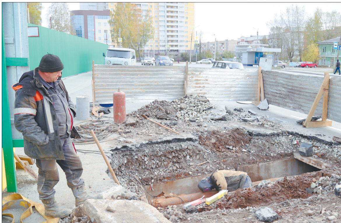
В прошлом году аварию на сетях у храма ликвидировали осенью.

По сообщениям Департамента информационной политики Свердловской области