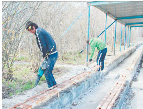
На трибунах уже начали бурить ямы для установки дополнительных опор, чтобы крышей закрыть все ряды кресел для болельщиков.