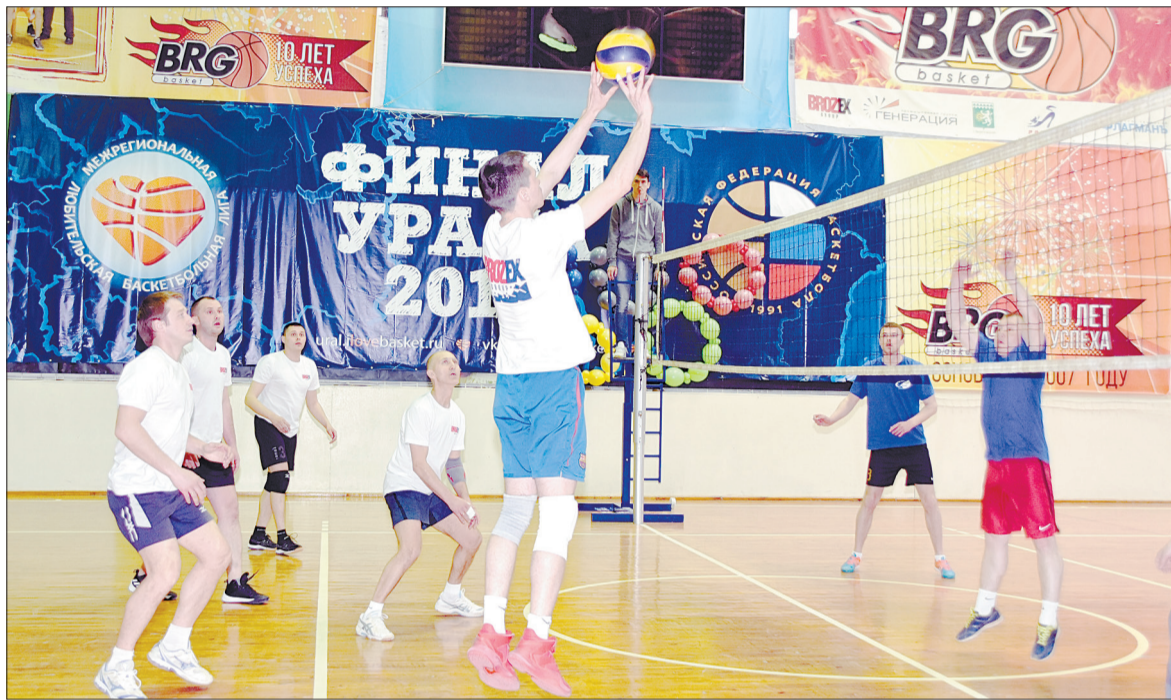
Волейболисты из группы компаний «Брозекс» не оставили четверым своим соперникам шансов на победу.

Ближайшие планы Пестича и Сенаторовой – выступление в составе сборной страны на этапе Кубка Европы среди кадетов (до 18 лет), который пройдет 24-26 мая в Португалии.