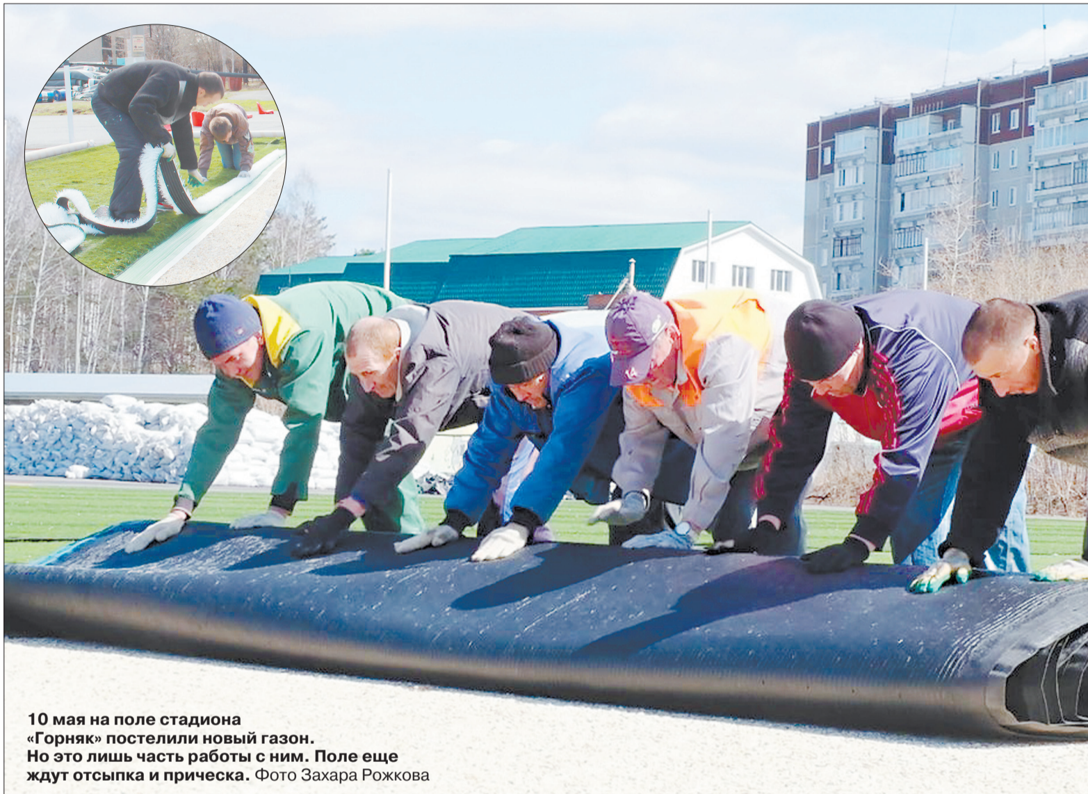
10 мая на поле стадиона «Горняк» постелили новый газон. Но это лишь часть работы с ним. Поле еще ждут отсыпка и прическа.

В это время рабочие тащат на поле деревянные поддоны и чем-то тяжелым наполненные мешки. Зачем? Оказывается, они выравнивают клейки разметочных линий.