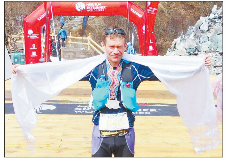
Финиш в Тибете, на высоте четыре тысячи метров

Пишите: gorka-info@rambler.ru Звоните по тел. (343) 247-83-34, сот. 8-900-204-19-61 Наш сайт: zg66.ru