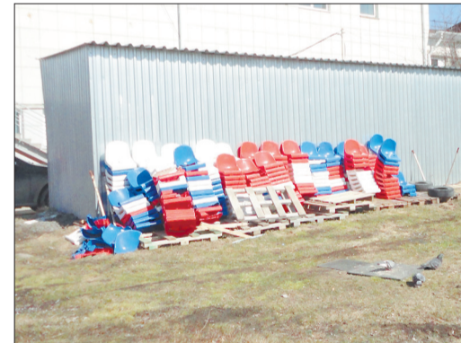
Неисправные сиденья болельщиков заменяют на новые, но цвет триколора на трибунах обязательно сохраняют.