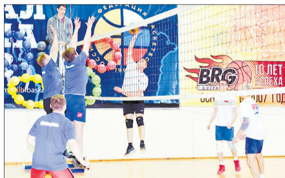
Спортсмены из «Флагмань» старались, но в тройку лидеров не попали