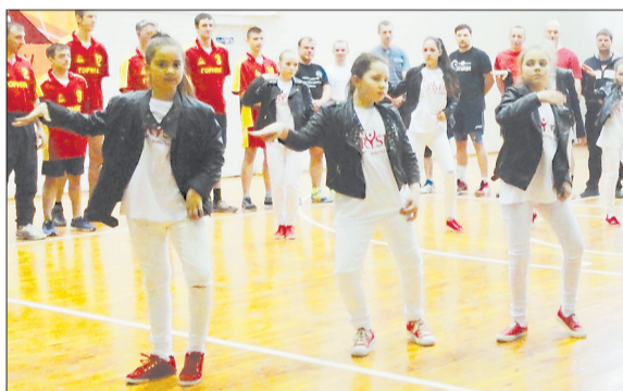
Танцем открывала спартакиаду команда школы Crystal.