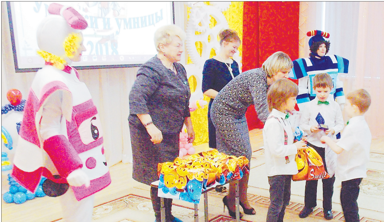
Номинаций фестиваля было много, поэтому без наград и подарков взрослые никого из маленьких «инженеров» не оставили.

– Мы представляем проект в защиту экологии. Ребята склеили макет мусоросжигательного