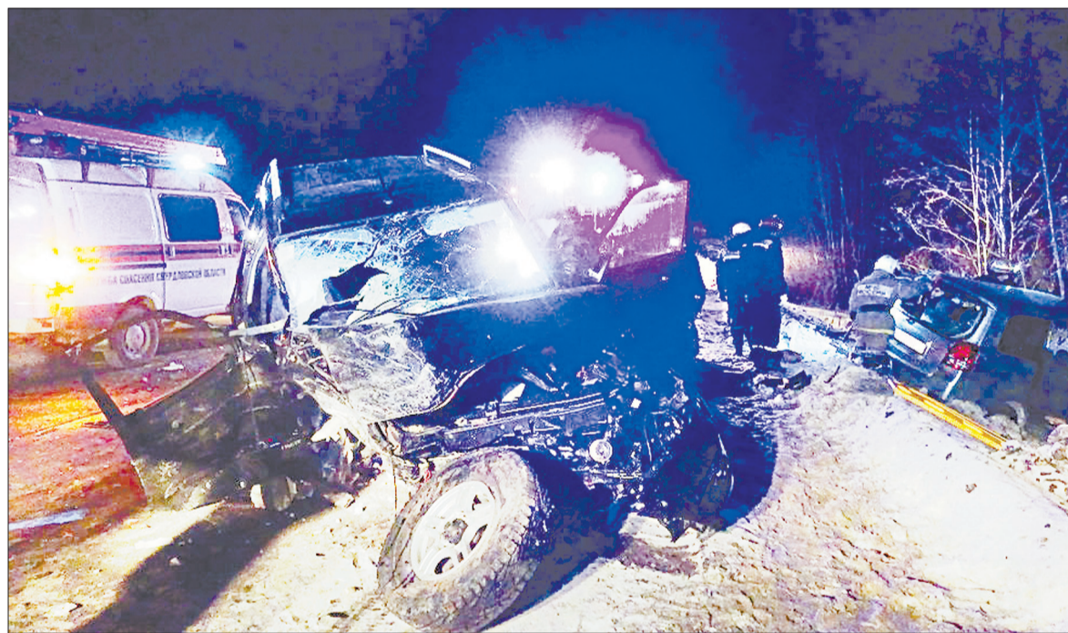
Удар от столкновения пришёлся на пассажирскую сторону «УАЗа». После аварии водитель внедорожника впал в кому.