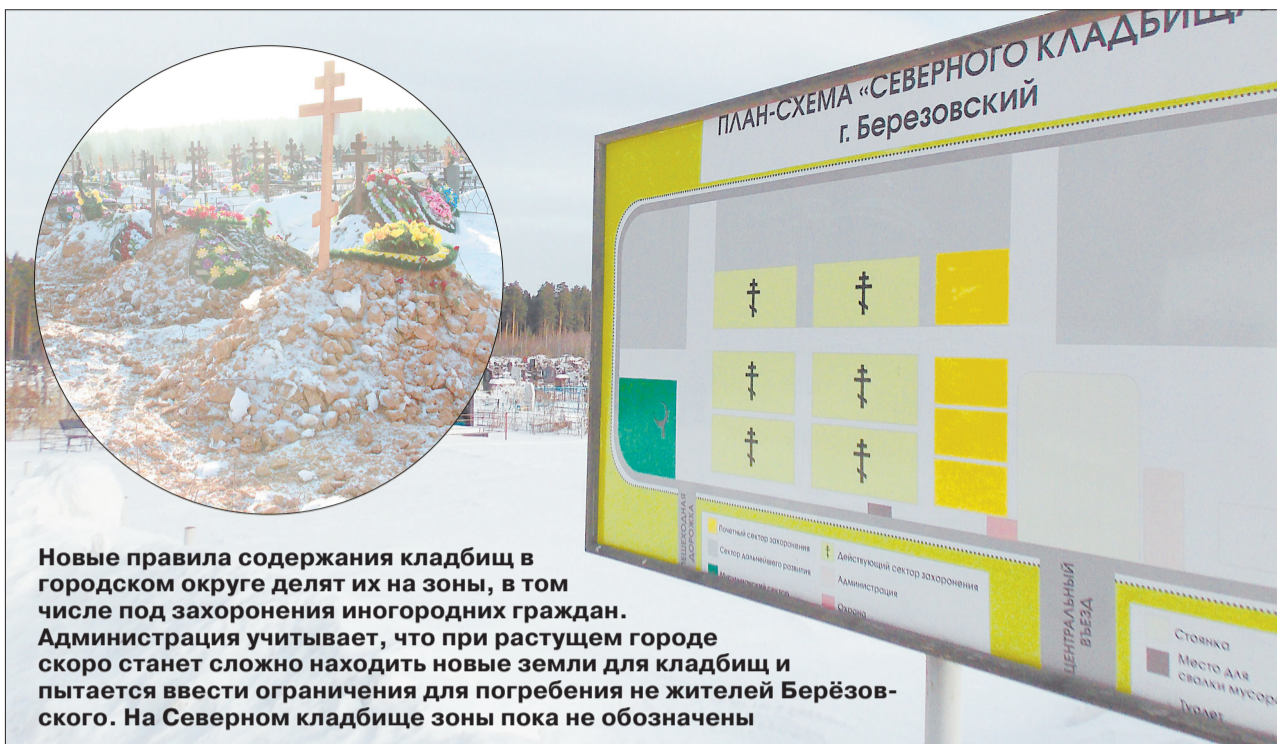
Новые правила содержания кладбищ в городском округе делят их на зоны, в том числе под захоронения иногородних граждан. Администрация учитывает, что при растущем городе скоро станет сложно находить новые земли для кладбищ и пытается ввести ограничения для погребения не жителей Берёзовского. На Северном кладбище зоны пока не обозначены

По сообщениям Департамента информационной политики Свердловской области