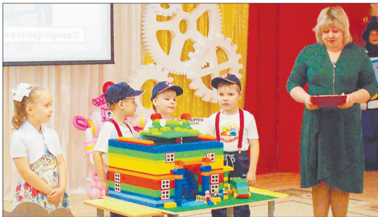
Ребята из детсада № 41 построили макет нового городского автовокзала.