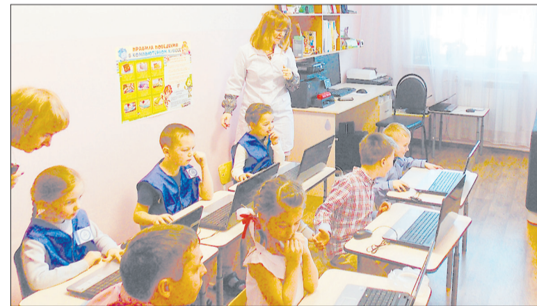
На производственной практике командам пришлось работать на компьютерах.