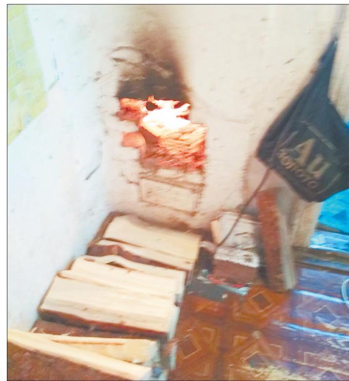
В таком состоянии обнаружили печь в многоквартирном доме представители надзорного ведомства во время рейда.