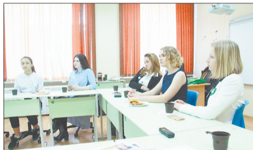
Юные журналисты получили много информации от студентов журфака