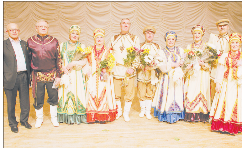
Вот так чествовали «Золотой каблук» на 10-летнем юбилее коллектива в дворце культуры «Современник».