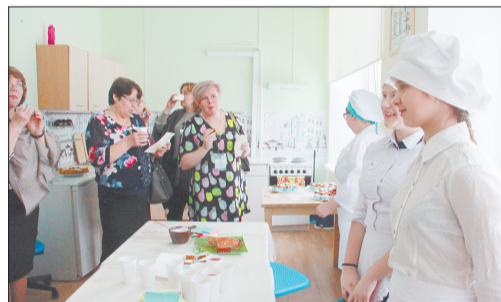
Ученицы 6 класса готовы были поделиться рецептами своих блюд