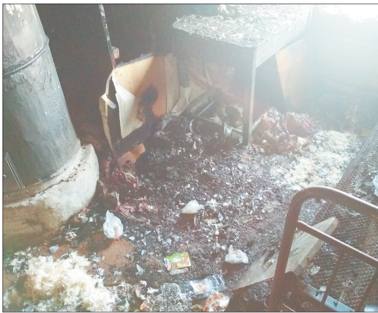
Пожилая женщина сказала, что ничего не помнит о том как случился пожар.

Задымление в указанном доме увидел сотрудник посел-