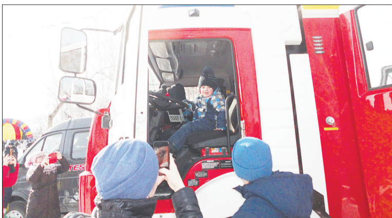
Большая очередь выстроилась в Историческом сквере к пожарной машине: детям не терпелось посидеть в кабине