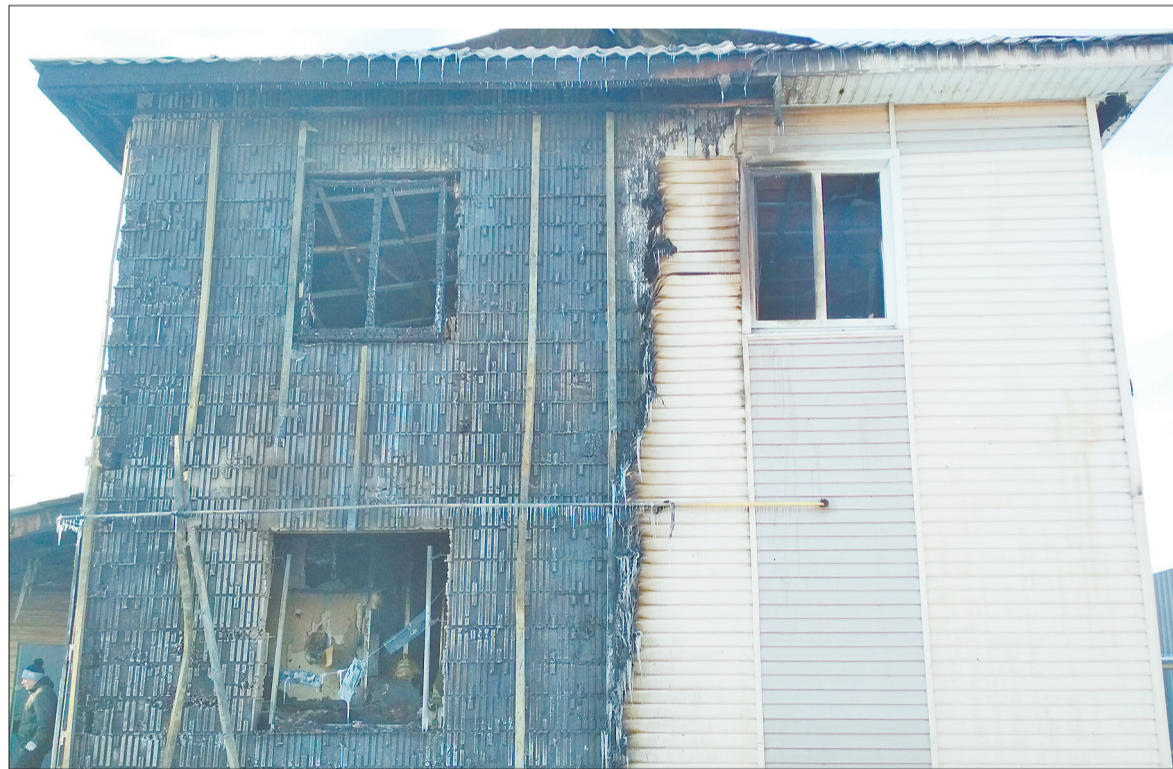
Чтобы спастись из полыхающего жилища, супруге поигбшего пришлось выпрыгивать из окна второго этажа.