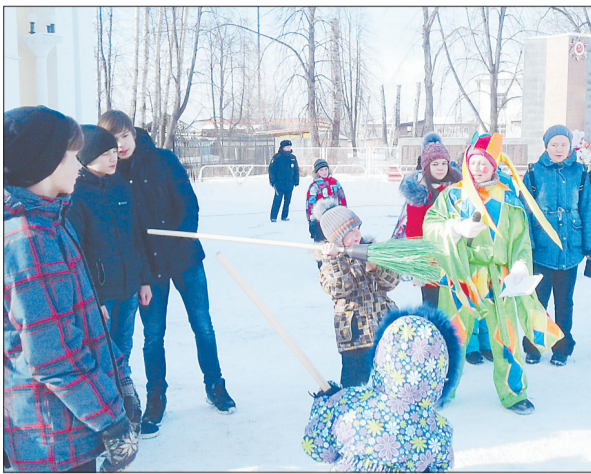
На широкую масленицу в Лосином блины ели, метлы на дальность кидали.

Рекламная служба: (343) 247-83-34, ул. Восточная, 3а-504