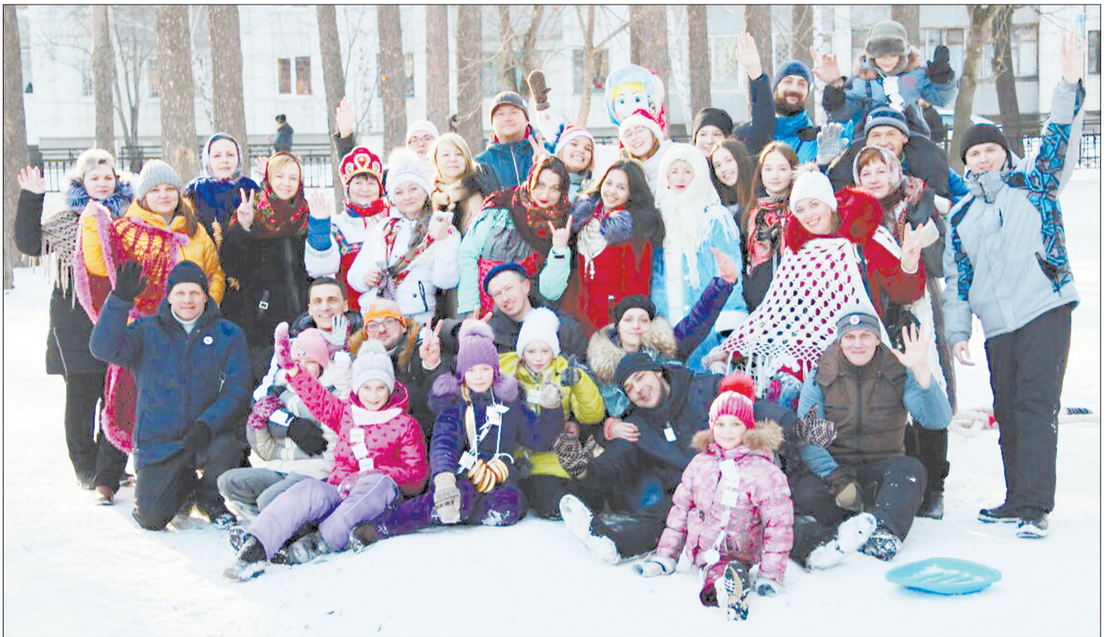
Объединенная команда родителей и детей новоберёзовского лицея № 3 «Альянс»