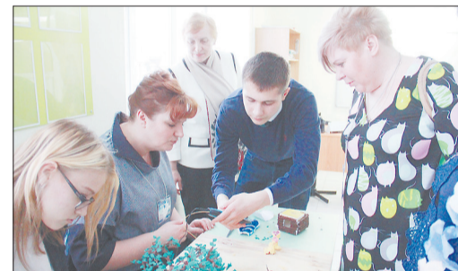
В первый раз 3D-ручкой и полимером работать очень непросто