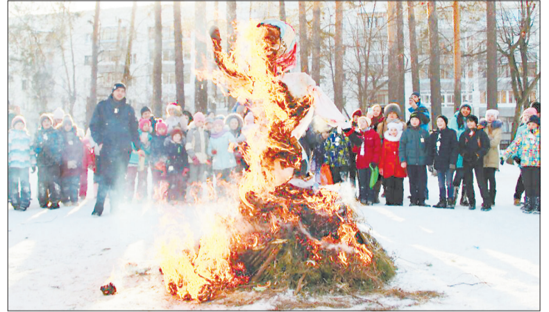
Момент, с которого началось ожидание весны для новоберёзовских школьников, — сжигание чучела