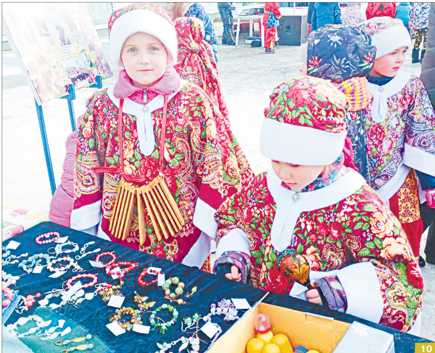
Официальный старт ожиданию весны был дан в Берёзовском, когда тысячи его жителей вышли на празднование Масленицы. Коллектив народной песни «Зарянка» (на фото) выступил и в Новоберёзовском микрорайоне, и в Историческом сквере – благо, гуляния растянулись на два дня.