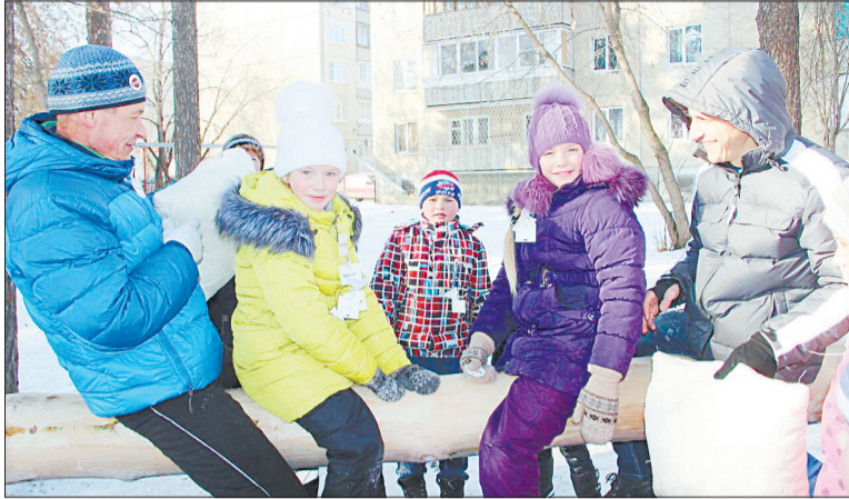
Дружные лицейсты: родители организуют своим детям праздник Масленицы второй год подряд