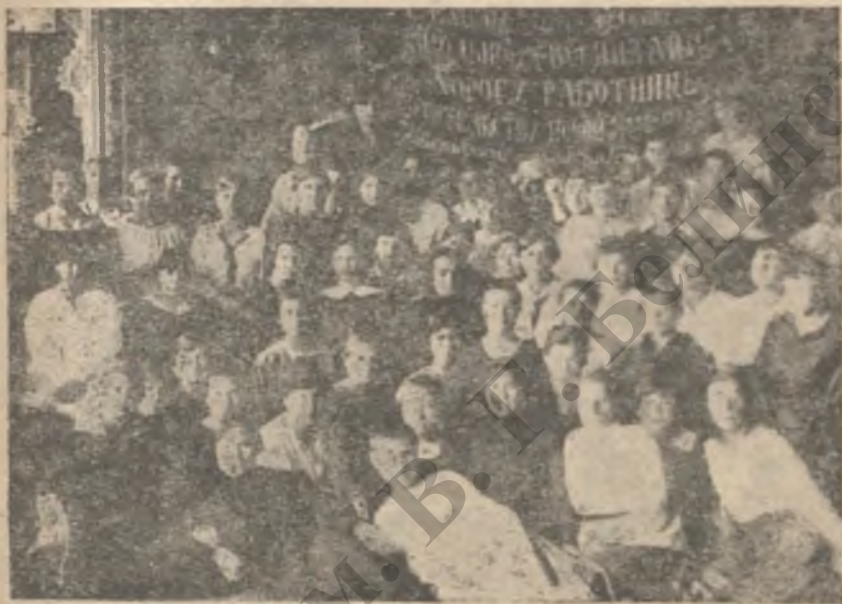
Курсы работниц по подготовке дошкольных работников.

И такая уверенность в победе звучала в их голосах!