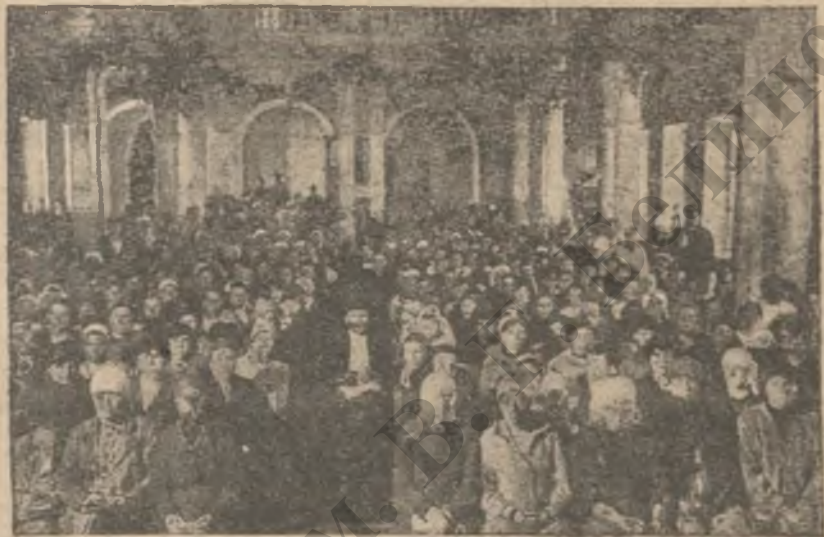
Конференция совхозниц и огородниц Москвы и Московской губ. 5 мая 1921 г.

войска белых. Все это надо было проверить. И вот мы поехали и перешли через границу. Чтобы проверить первое сведение, я направилась в Двинск, где я так долго жила при казармах. Там я встретила много немецких солдат, старых знакомых. Разговорилась с ними. В то время в немецких войсках были созданы советы. Офицерам приходилось считаться с ними, если не сказать—подчиняться. В советах были большевики-коммунисты. Мои старые знакомые немецкие солдаты, в большинстве случаев металлисты и пекаря, помогли мне собрать нужные сведения. Затем, установив связь с железнодорожными рабочими, я уехала. Кстати сказать, железнодорожники тогда становились все