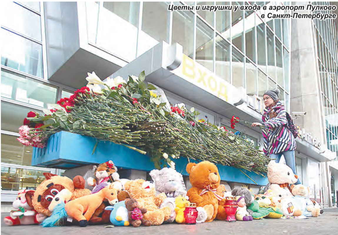
Цветы и игрушки у входа в аэропорт Пулково в Санкт-Петербурге