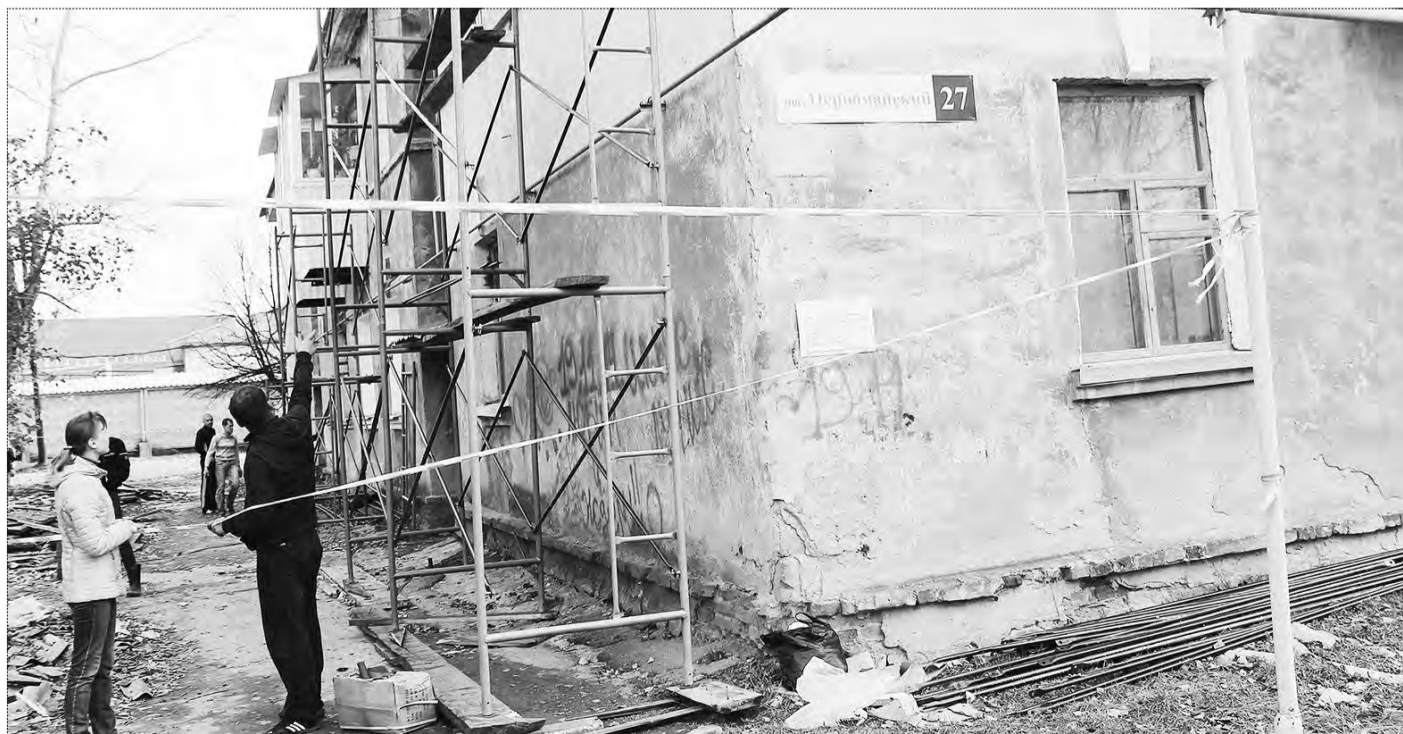
Ремонт фасада дома № 27 в пос. Первомайском, по-видимому, перенесут на весну...

А еще «Термотехника» попросила перенести срок сдачи объектов на 26 календарных дней, ссылаясь на то, что приступила к выполнению подряда с опозданием из-за не зависящих от нее обстоятельств. Дело в том, что конкурс выиграл «Ресурс», но второй его участник – «Термотехника» – подал жалобу в ФАС, найдя зацепки в деле. В итоге она опередила «Ресурс» и стала победителем на лот в 12 домов. Но при этом золотые денечки потеряла. Теперь подрядчик рассчитывает, что трех недель хватит, чтобы нагнать отставание. Да и терпение жителей на исходе: ремонт вызывает положительные эмоции только по его окончании.