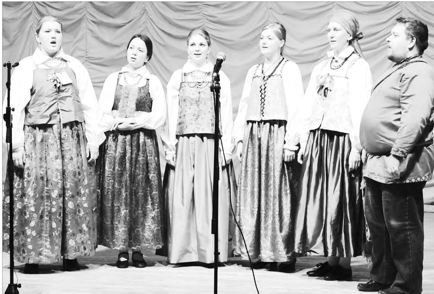
«Живая СтАрина» раскачала «Очаровательные глазки» так, как это делали в селах Приангарья

Всероссийский фестиваль организован в честь святого, но на площадках и мастер-классах звучат вполне светские песни – озорные и грустные, на сцене танцуют – в общем, нет ничего пресного и скучного. И еще к слову. Несмотря на то что «Дмитриев день» – праздник мужской культуры (как заявлено), на концертах среди выступающих женщин почему-то больше, чем мужчин. Видимо, прекрасная половина человечества считает своим долгом сохранять не только домашний очаг, но и родники народной культуры.