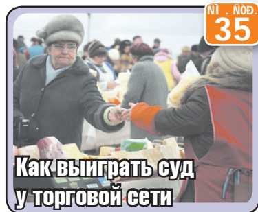
Как выиграть суд у торговой сети