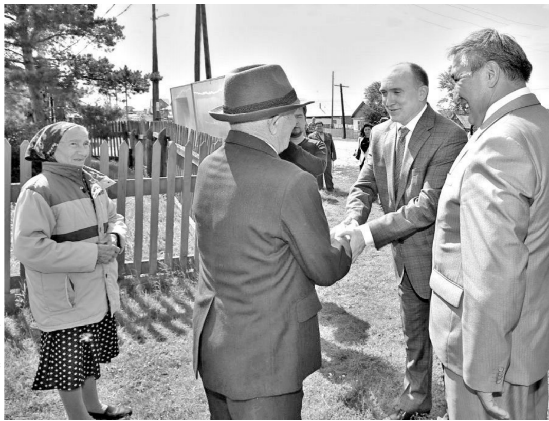
Александр Скрипов, глава администрации Челябинской области, в Париже.

Интересно, что дополнительные источники финансирования для программы искать не пришлось. Все 500 миллионов были получены за счет экономии расходов бюджета. Как сообщили в областной администрации, в приоритетном порядке средства будут направляться на объекты, где