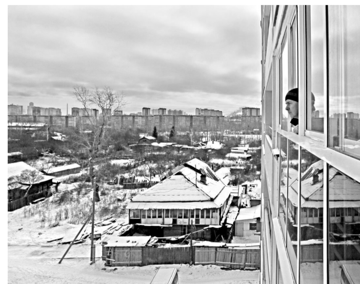
Участки, занятые ветхими малоэтажными домами, станут в ближайшие годы одним из главных ресурсов развития Екатеринбурга.