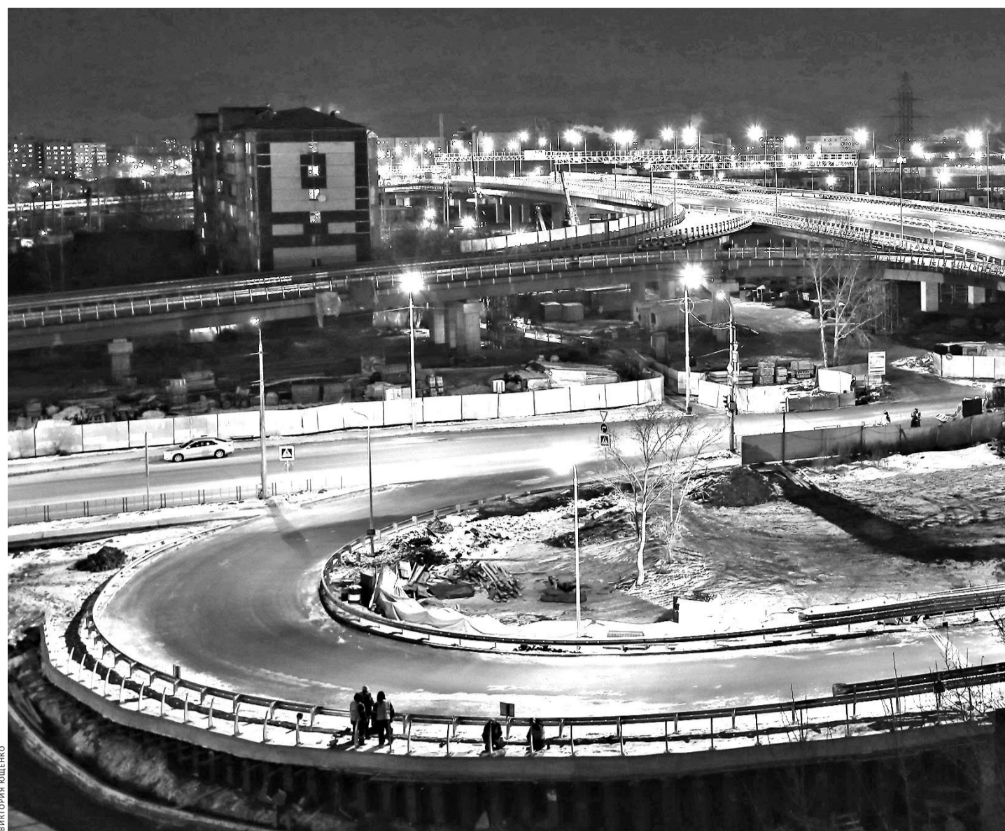
В Тюмени запустили четвертый путепровод через Транссиб. Долгожданная развязка стала крупнейшим инфраструктурным объектом, возведенным за последние годы. Ее строительство началось в сентябре 2012-го. Пока открыто движение по прямому ходу на мосту от улицы Широкой до улицы Республики в прямом и обратном направлении, а также первые три съезда. Длина путепровода — 743,5 метра, а общая протяженность развязки со съездами и реконструированными примыкающими улицами — более шести километров. Раньше на дороге из восточной части города до центра даже при отсутствии пробок уходило около часа, теперь — не более десяти минут. Полностью завершить объект планируется до конца 2015 года.