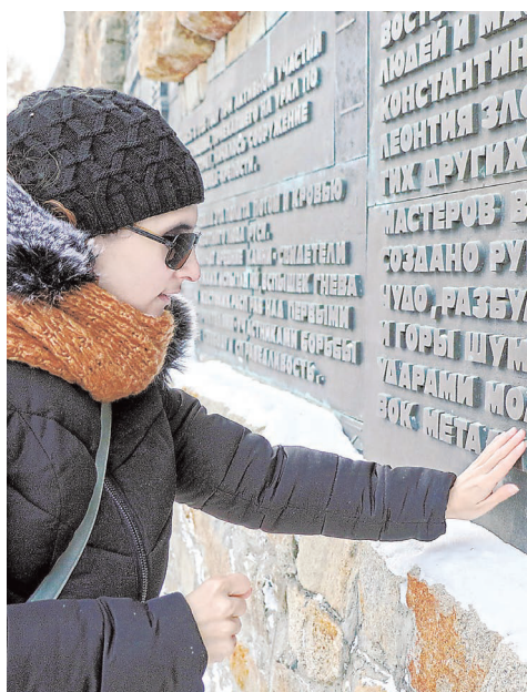
Екатеринбуржцы кончиками пальцев «прочувствовали» достопримечательности родного города.

Так появилось несколько вариантов экскурсий по историческим местам. Помимо проекта для незрячих, это путешествия для людей с нарушением слуха, проблемами опорно-двигательного аппарата или ментальными особенностями. Для каждого готовится