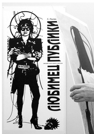
Художник умеет в паре образов рассказать о сути спектакля.

— Я начал делать плакаты, потому что мне это было интересно. После завершения работы над спектаклем пытаешься понять, о чем он. Загады-