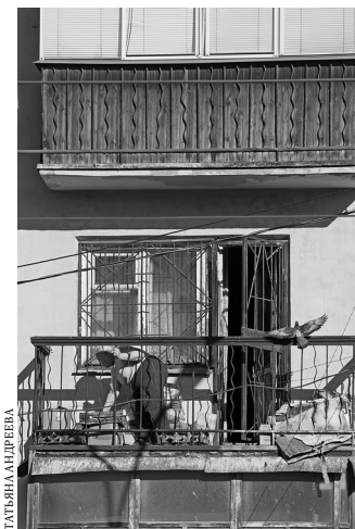
Жильцы обязаны обеспечить доступ к общему имуществу собственников дома.