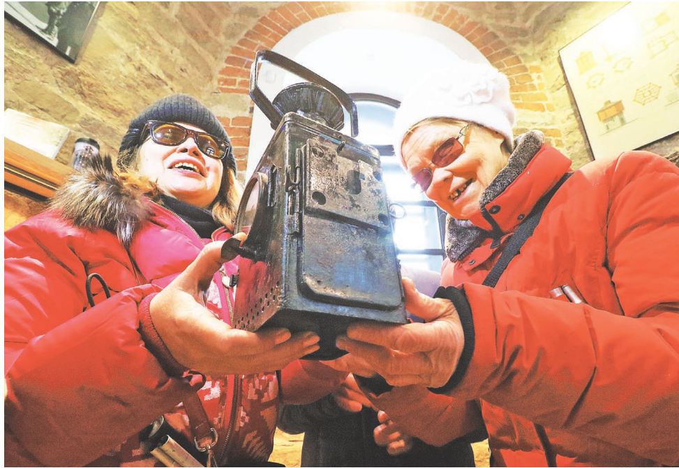
В помещении водонапорной башни экскурсантов заинтересовал старинный керосиновый фонарь.

В Екатеринбурге проложили туристический маршрут для незрячих