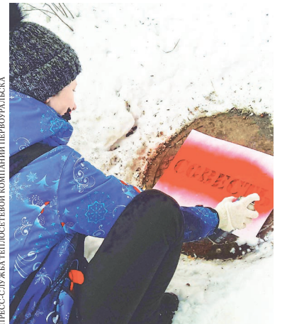
Таким необычным способом активисты надеются в том числе призвать похитителей люков к совести.

В январе правоохранители и коммунальщики забили тревогу: в Первоуральске эпидемия краж люков. Только за последние недели воры унесли 12 технологических крышек. Действуют злоумышленники не только во дворах отдаленных районов, но и в центре города — на улице Герцена. Полиции удалось задержать только одного грабителя: в пунктах приема металлолома держат оборону и не сдают поставщиков чугуна.