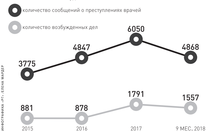
ИНФОГРАФИКА «РГ» — ЕЛЕНА МАРДЕЕ

Источник: СУ СКР по Свердловской области