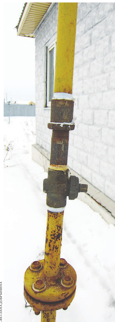
Через эту трубу здание наконец подключили к благам цивилизации.