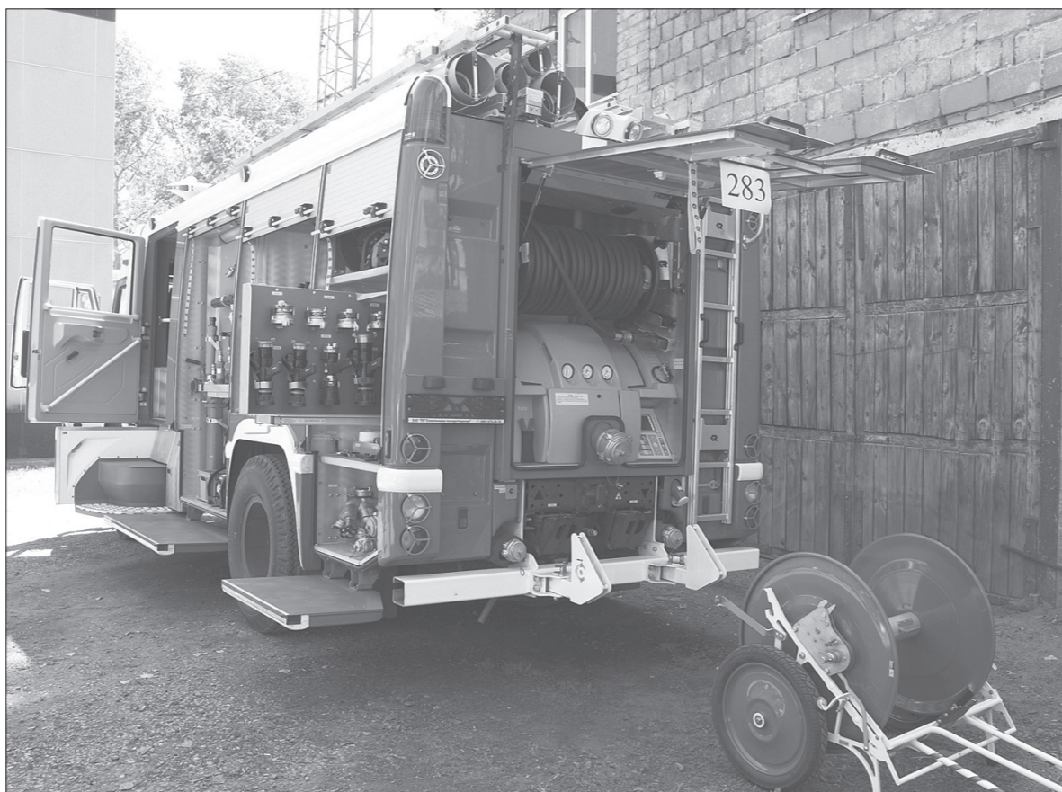
* Новый пожарный автомобиль.

В конце мая на вооружении тагильских огнеборцев появился современный пожарный автомобиль.