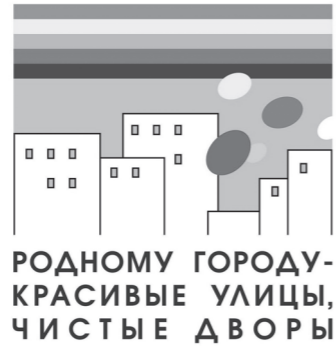
РОДНОМУ ГОРОДУ - КРАСИВЫЕ УЛИЦЫ, ЧИСТЫЕ ДВОРЫ

Из других новинок организаторы отмечают «Час местных производителей», фотоэкспозицию «Красивый город - руками тагильчан» и