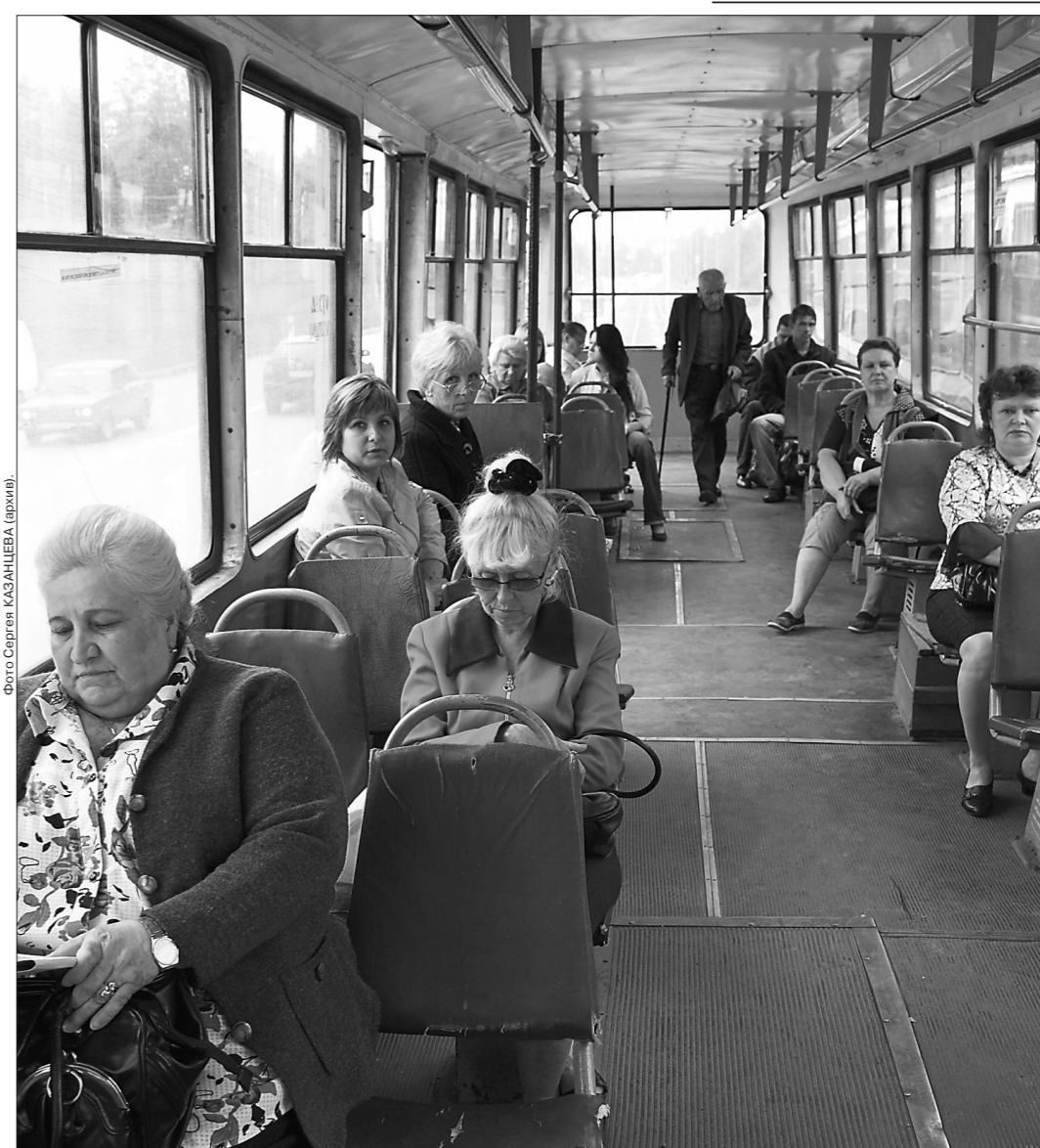
* В трамвае на одном из вагонских маршрутов.