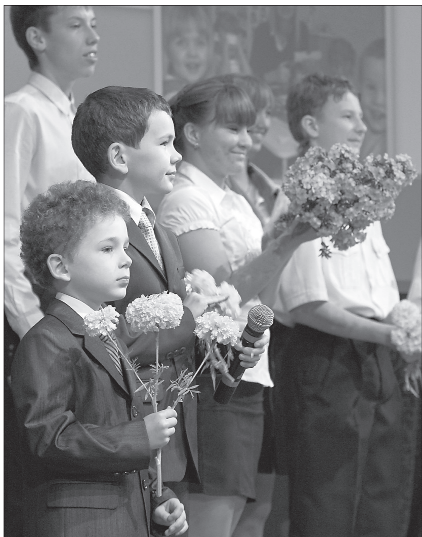
* Дети поздравляют педагогов.