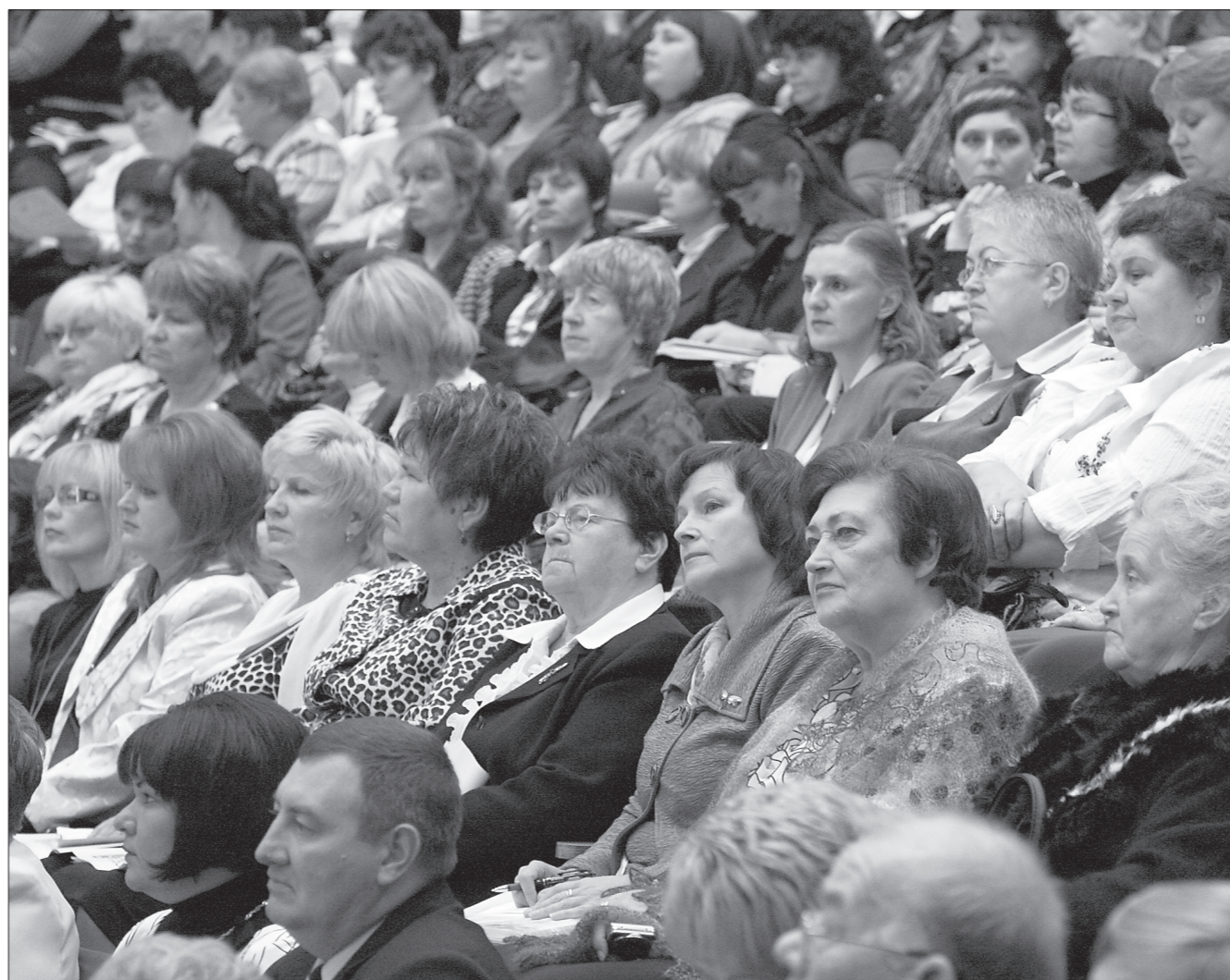
* В зале не было свободных мест.