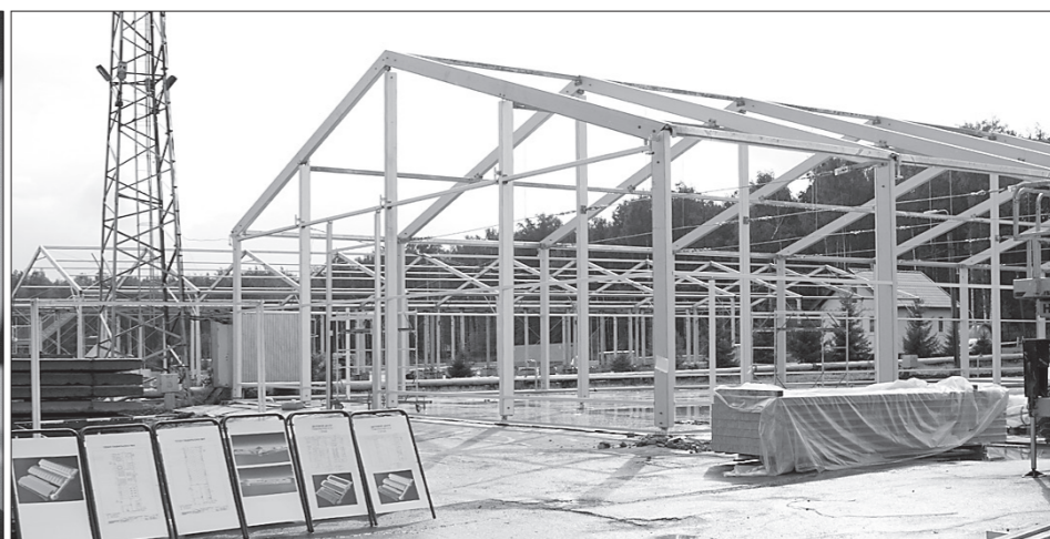
* Подготовка идет полным ходом.

Насколько Нижний Тагил готов к этому важному событию, оценили члены областного оргкомитета. Министр