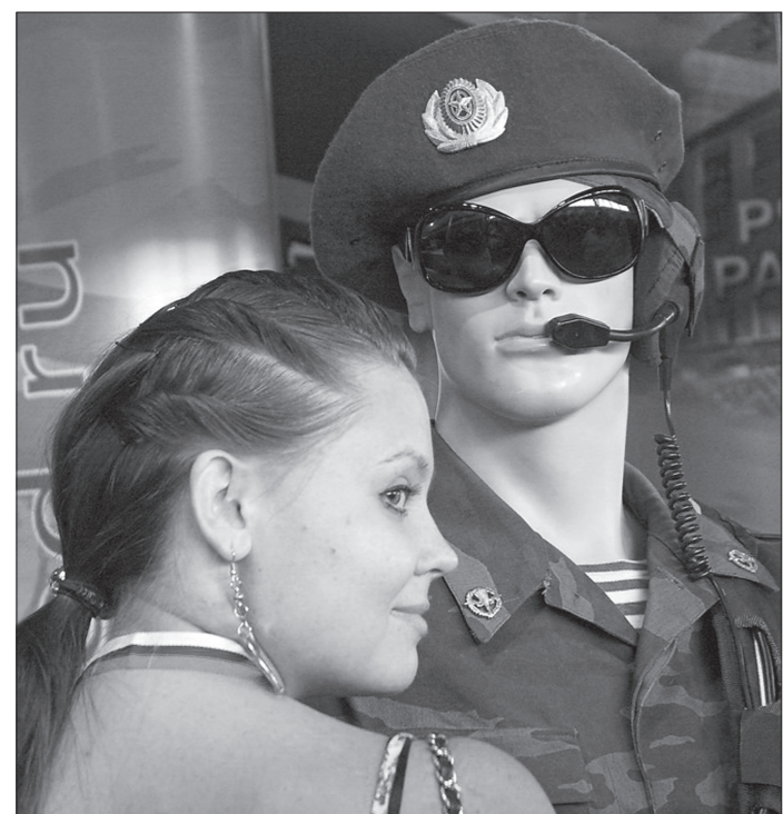
* Один из моментов прошлогодней выставки.

8-я «Российская выставка вооружения. Нижний Тагил-2011», которая пройдет на Среднем Урале с 8 по 11 сентября, станет площадкой для демонстрации высокотехнологичных достижений не только «оборонки», но и всей промышленности, что делает ее логическим продолжением выставки инноваций ИННОПРОМ-2011. Об этом сообщил министр международных и внешнеэкономических связей Свердловской области Александр Харлов.