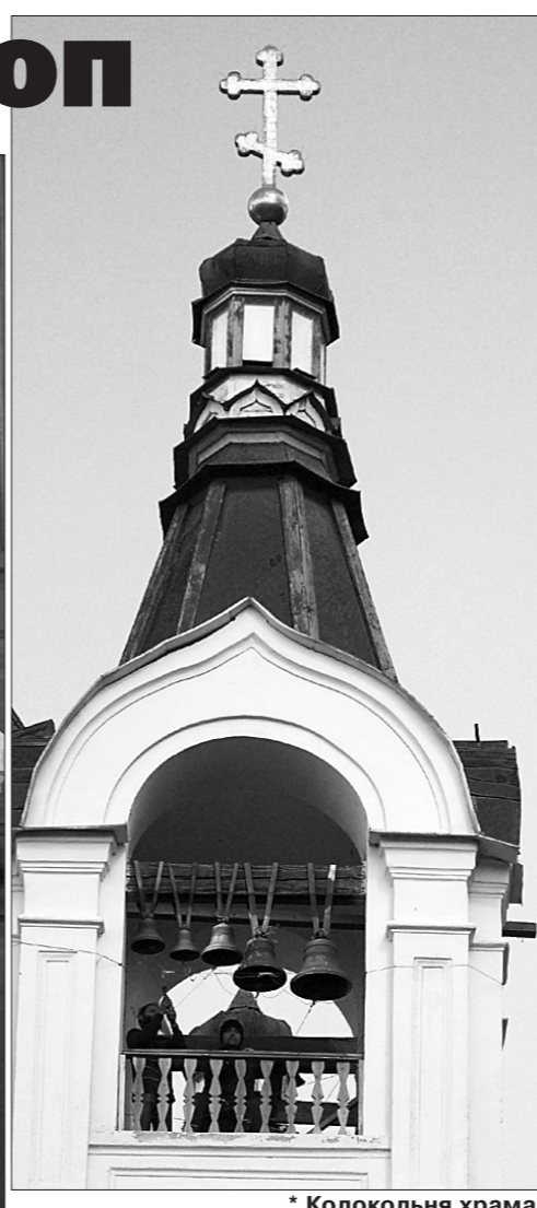
* Колокольня храма Александра Невского.