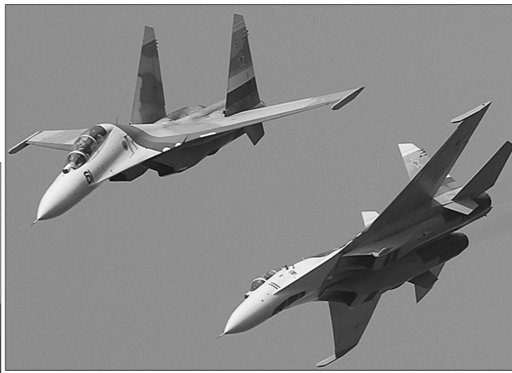
* Воздушный бой.