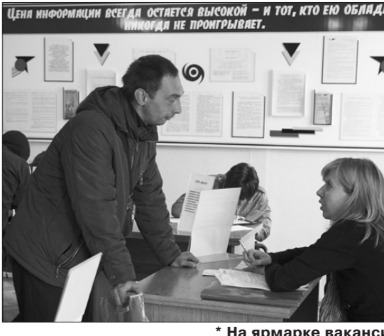
На ярмарке вакансий.

Ярмарки вакансий как одна из форм работы с работодателями проводятся в центре занятости два раза в месяц; в третью среду месяца - в Ленинском районе, в четверг - в Дзержинском. Информация об их проведении размещается заранее, поэтому, как правило, в эти дни в службе занятости бывает многолюдно.