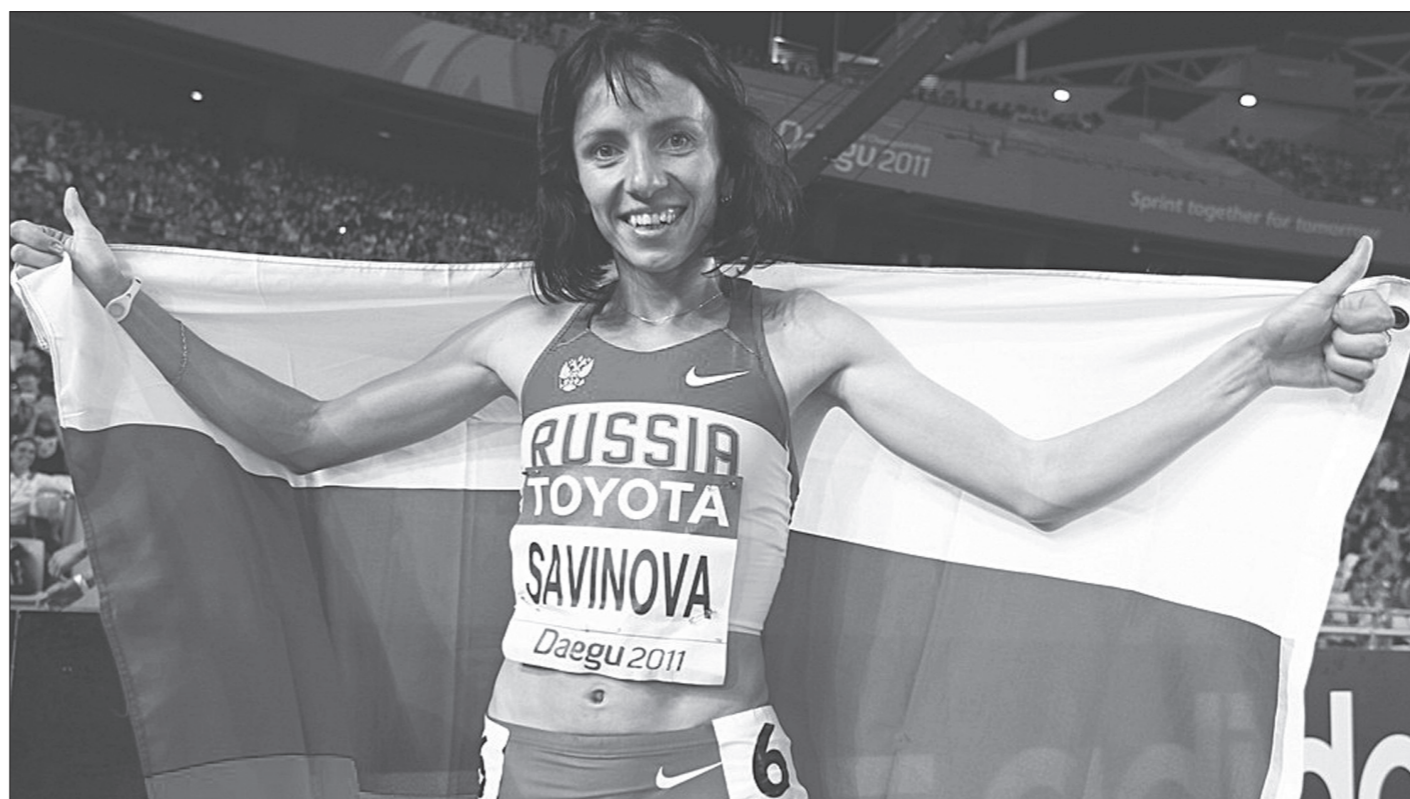
* Мария Савинова – чемпионка мира!

В конференциях и пленарном заседании примут участие представители соответствующих министерств и ведомств страны, в том числе Министерства обороны РФ, руководители крупнейших предприятий. Таким образом, выставка становится не только местом демонстрации вооружения, но и площадкой для определения дальнейших путей развития оборонно-промышленного комплекса, перспектив создания армии и вооружения нового облика, сообщает пресс-служба НТИИМ.