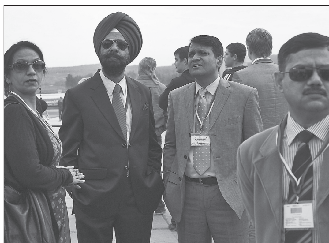
* Гости из Индии внимательно наблюдали за авиашоу.

массовой информации. Организаторы заявили о том, что выставка превзошла все ожидания. С приветствием к участникам обратился президент России Дмитрий Медведев. Лично познакомился с работой выставки и образцами военной техники премьер-министр Владимир Путин. Принято решение о создании федерального центра испытаний и демонстрации военной техники и вооружения на базе демонстрационно-выставочного центра в Нижнем Тагиле, а это означает выход на каче-