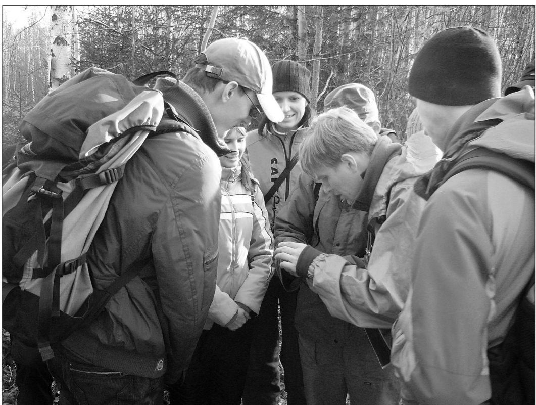
* Ориентировались по карте и компасу.