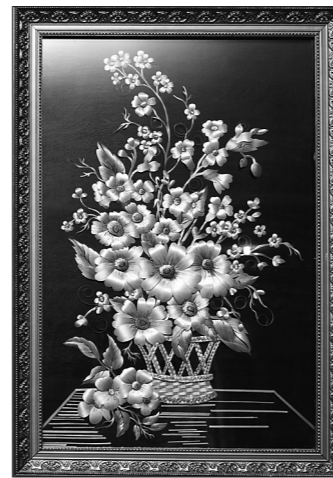
Д. Суханкина. «Полевой букет», соломка.