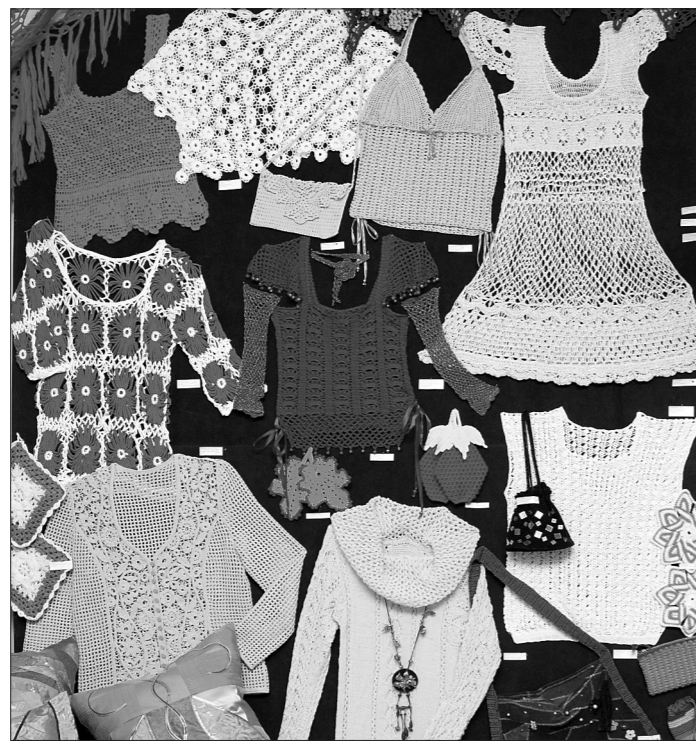
Традиционные вязаные наряды.

Чем пытались удивить посетители мастера? Цветами из бисера, поделками из конфет, фигурками из глины, вышитыми картинками, лоскутным шитьем, комплектами украшений из металла и кожи. Рукодельницы из Верхней Салды представили серию произведений из соломки, преподаватель тагильской детской художе-