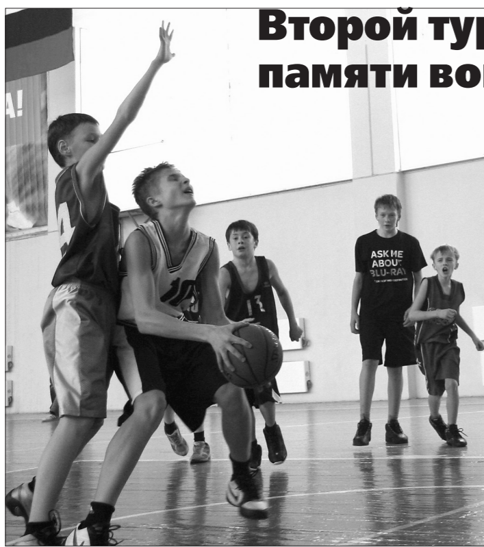
У мальчишек – финальный матч.