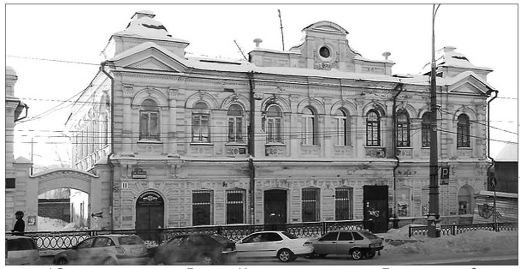
* Здесь, по адресу: пр. Ленина, 11, находится редакция «Тагильского рабочего».