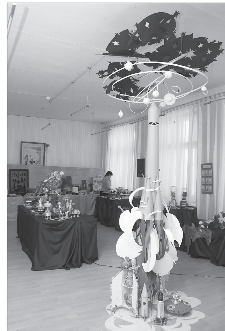
* Ракета в центре экспозиции выставки декоративно-прикладного творчества гимназистов.