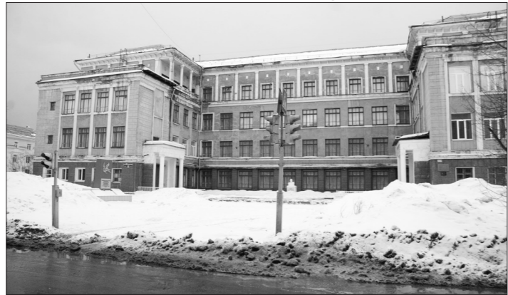
* Улица в реальности.