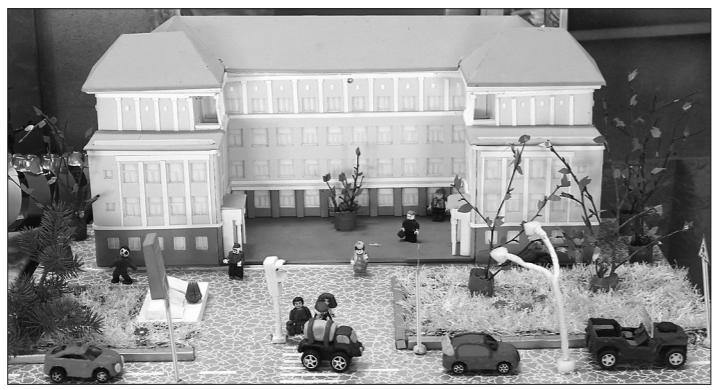
* Пешеходный переход перед школой, коллективная работа учащихся школы №9.