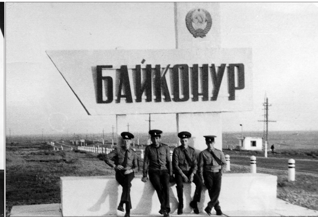
* После работы.