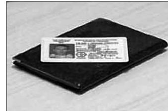
Прокуроры выявили многочисленные факты получения водительских удостоверений при предоставлении поддельных медицинских справок. Прокуроры направили материалы в следственные органы по фактам выдачи фиктивных справок в отношении должностных лиц межучреждений в Мордовии, Татарстане, Астраханской, Кировской, Московской, Нижегородской и Свердловской областях, Ямало-Ненецком автономном округе. В Воронежской и Липецкой областях районные врачи-наркологи уже осуждены по ст.290 Уголовного кодекса РФ (получение взятки), ст.292 УК РФ (служебный подлог).

В судах регионов РФ принимают меры по признанию недееспособными 14 тыс. водителей с нарушениями, выданными лицензиями на алкоголь и наркоманам.