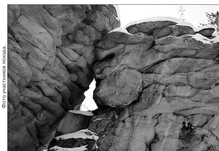
В этой скале Дмитрий Комаров разглядел сфинкса.

Туристы клуба «Азимут» совершили трехдневный поход в Челябинскую область на Аракульские шиханы. Невысокая горная гряда (от 30 до 60 метров) на берегу озера - идеальное место для отработки альпинистских навыков.