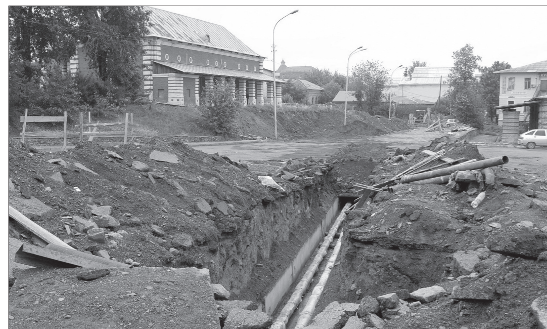
На время ремонтных работ улица Уральская стала похожа на поле боя.