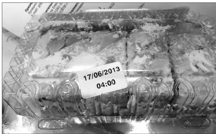
Злополучное пирожное.