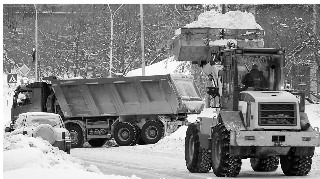
Днем 24 декабря отгружали снег с обочин улицы Карла Маркса. Работает МУП «Тагилдорстрой».

Как уже сообщал «ТР», в январе за уборку снега дорожники взялись активно и работали днем и ночью.