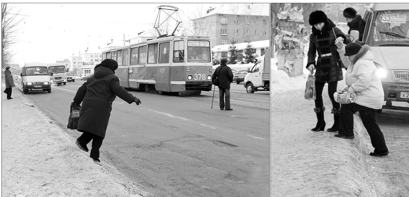
Успеть бы на трамвай и уцелеть! ФОТО СЕРГЕЯ КАЗАНЦЕВА.