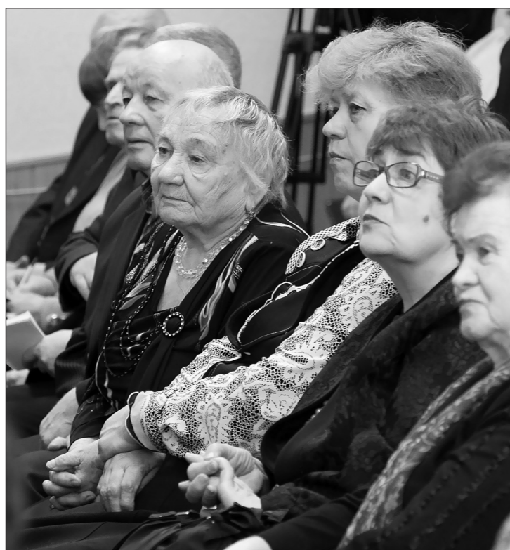
Участники заседания совета ветеранов.