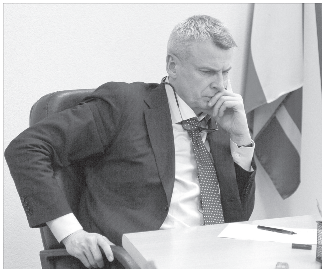
Глава города Сергей Носов.