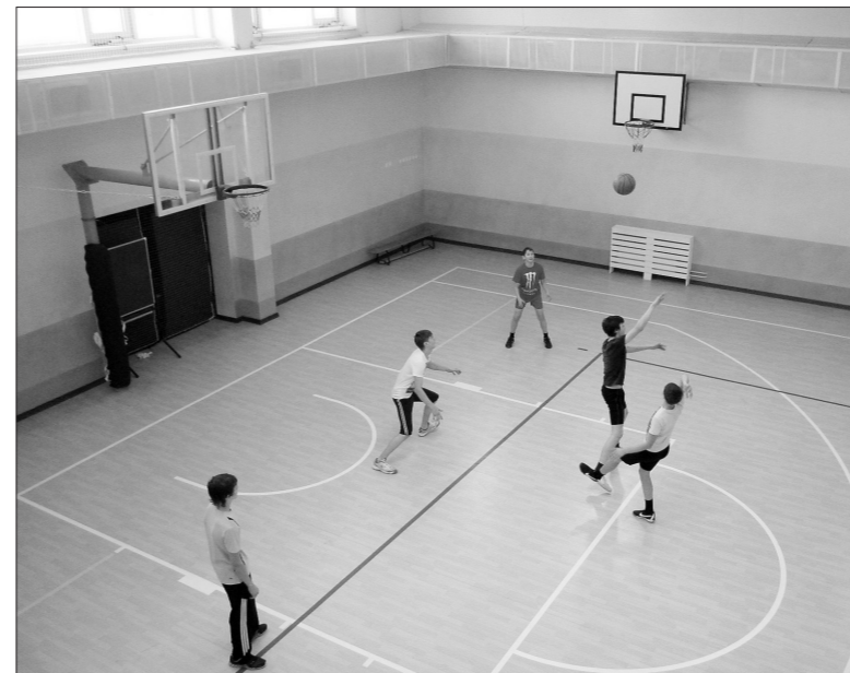
Школьный спортзал - просторный и светлый.