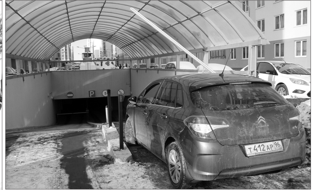
Под каждым жилым домом - подземная парковка.