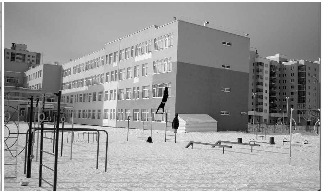
Спортивная площадка возле школы №16.