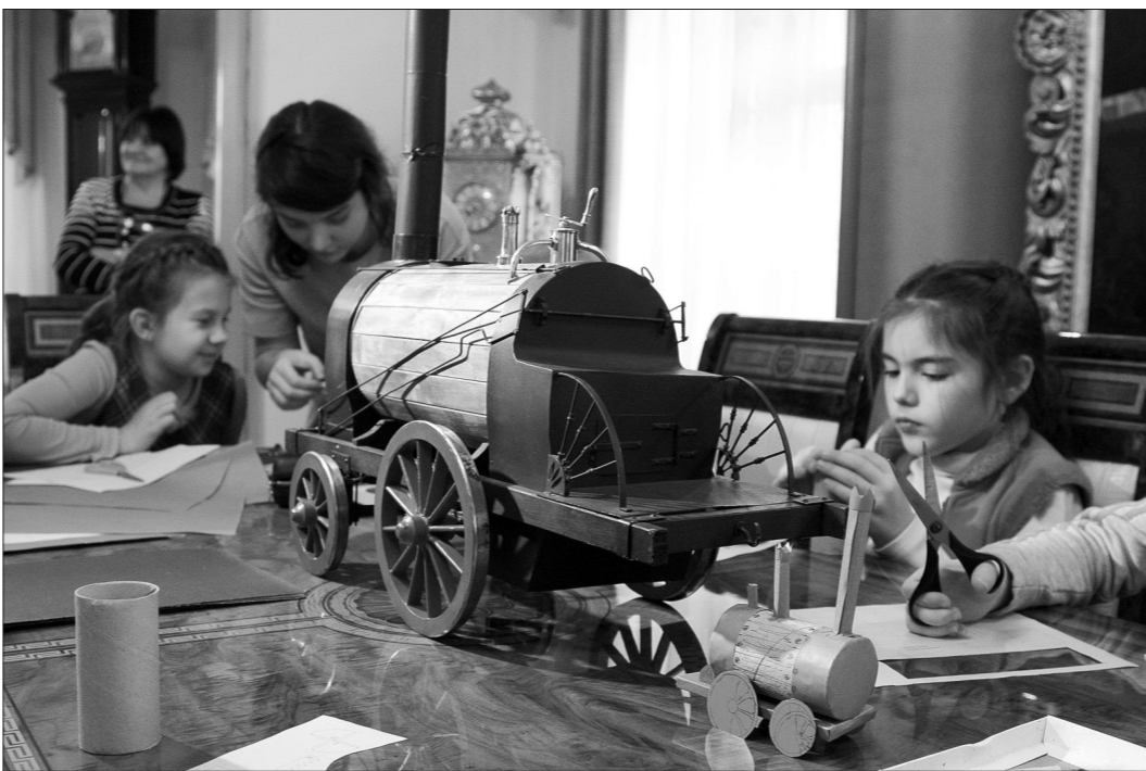
Паровоз можно сделать из бумаги и картона.

В музее истории техники Дома Черепановых открылась мини-выставка, посвященная 210-летию Мирона Ефимовича Черепанова.