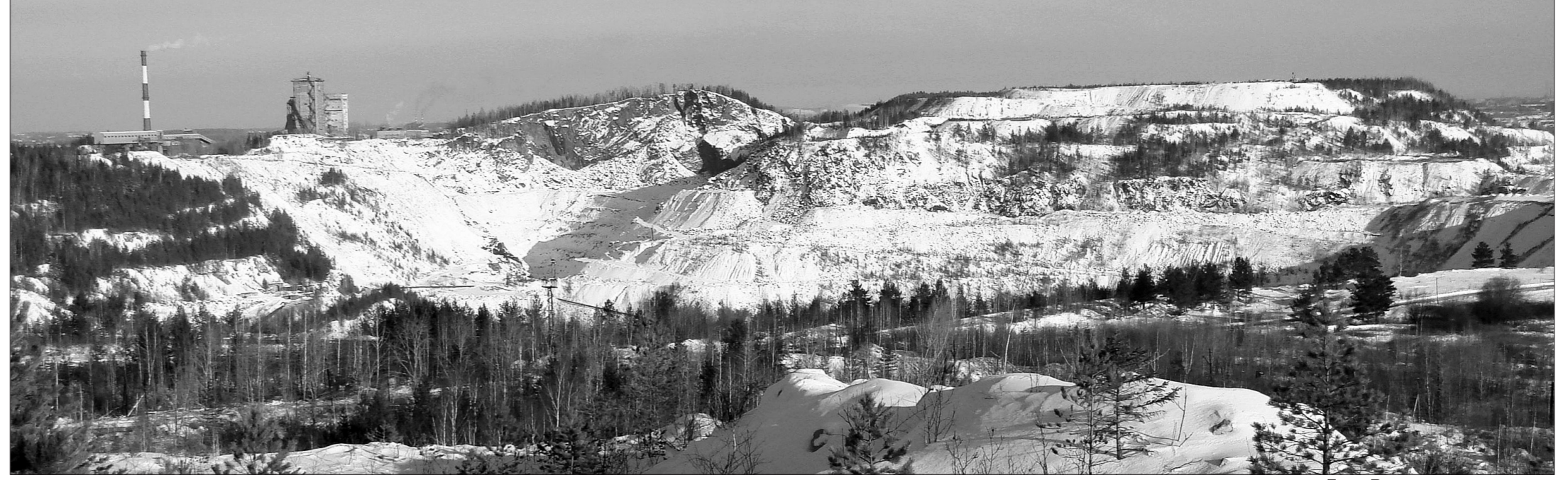
Гора Высокая.

5 августа 1849 года владельцы Нижнетагильских заводов через главноуполномоченного А.И. Кожуховского установили: ежегодно в память о книне Акинфия Демидова совершать крестный ход по границам Высокогорского железного рудника, отделившего владения господ Демидовых от других. После обхода границ Высоко-