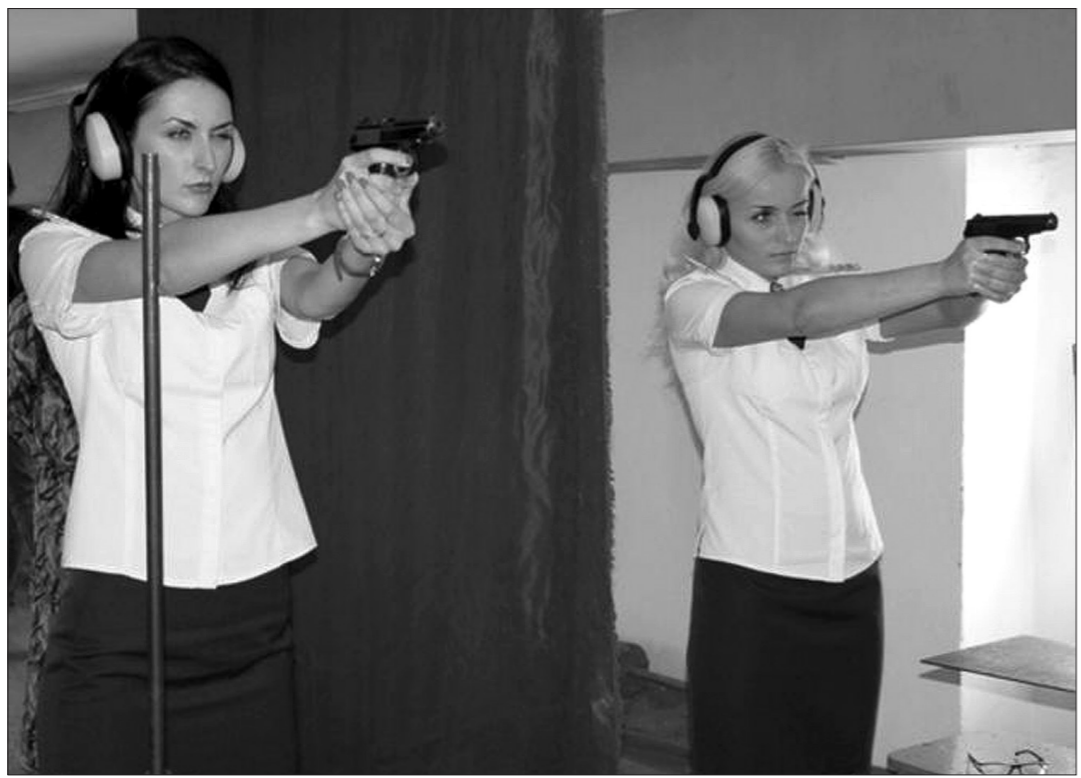
На соревнованиях по стрельбе из пистолета Макарова.