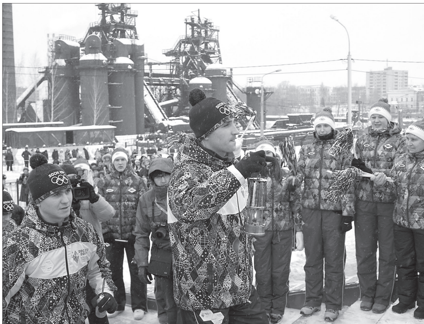
От этой лампы зажгли первый факел.