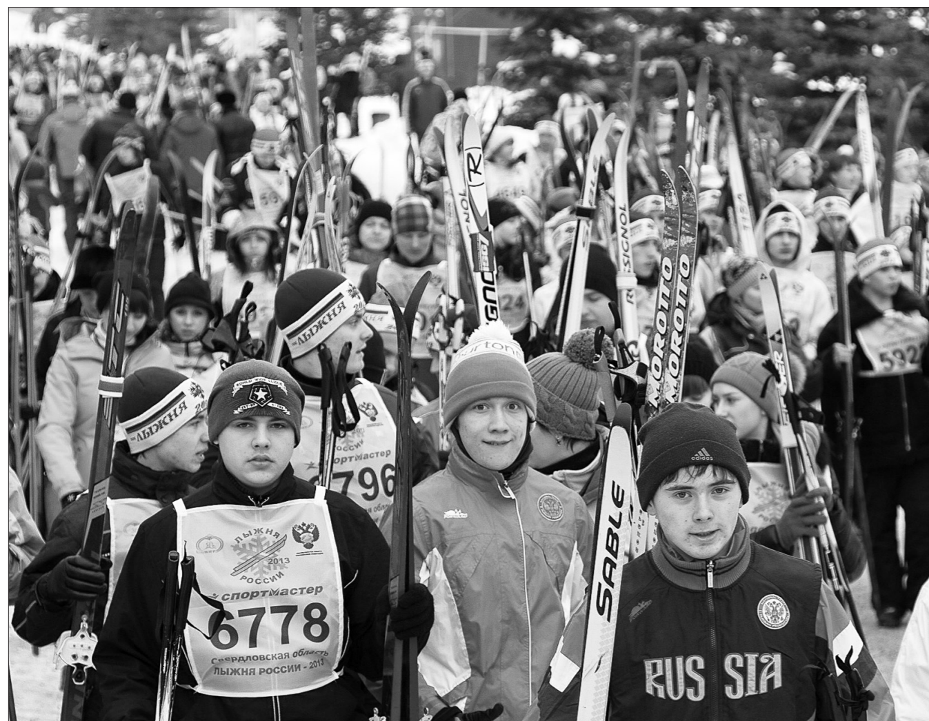
Участники массового забега.