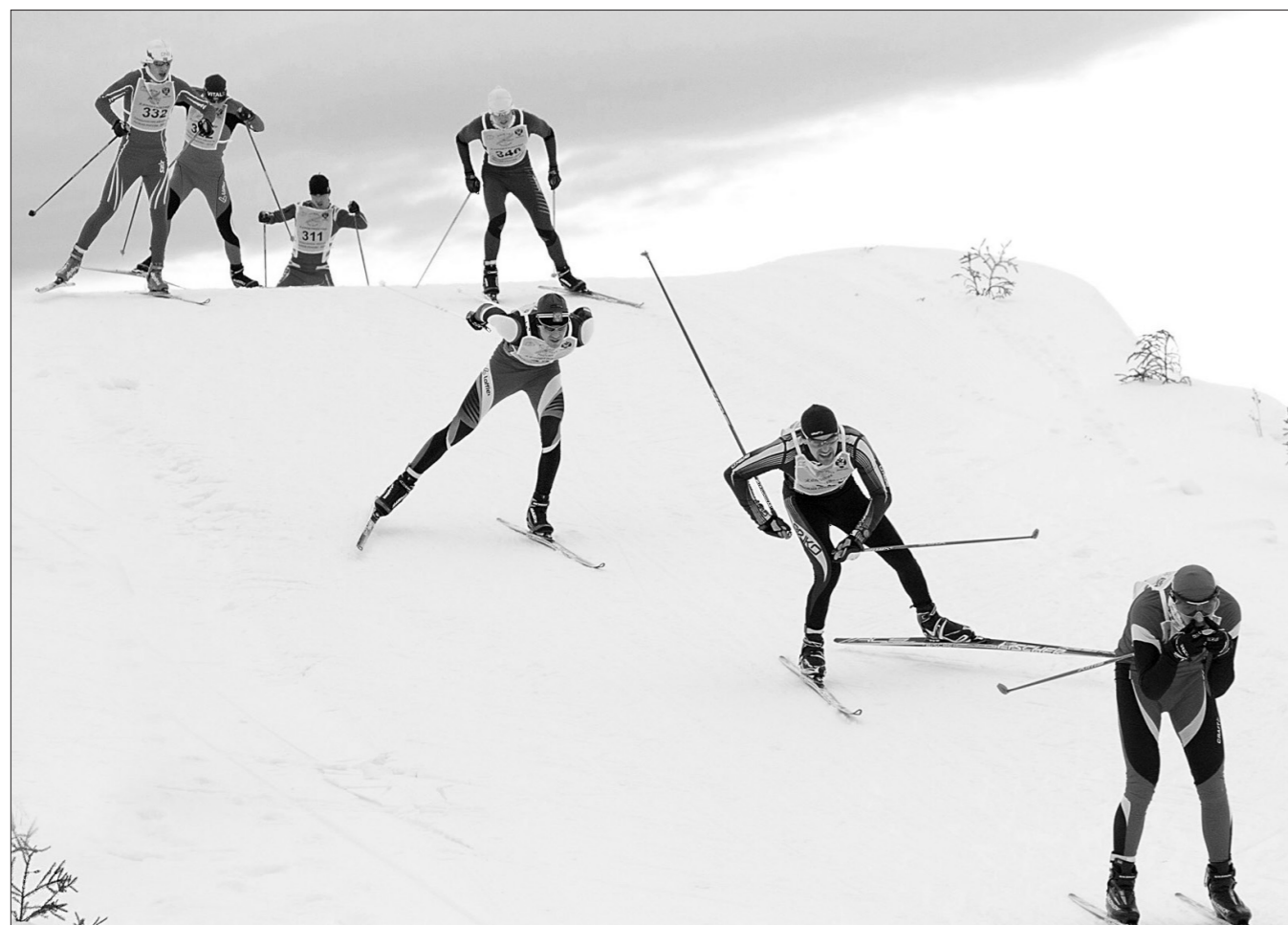
Идет мужская гонка.