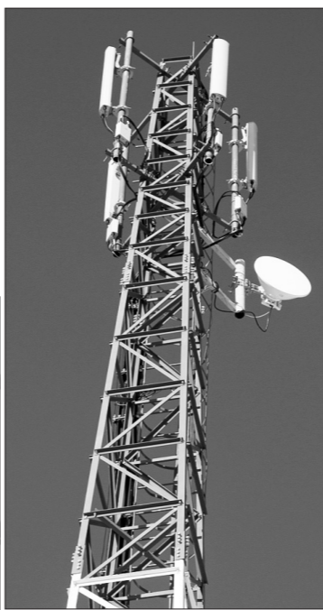
Базовая станция имени Мирона Черепанова. Ее высота 40 метров.

Новый объект высотой 40 метров с радиусом уверенного приема пять километров сможет обеспечить сотовой связью и мобильным Интернетом более 1000 абонентов, живущих в селах Никола-Павловское, Братчиково и на станции Монзино, а также владельцев много-