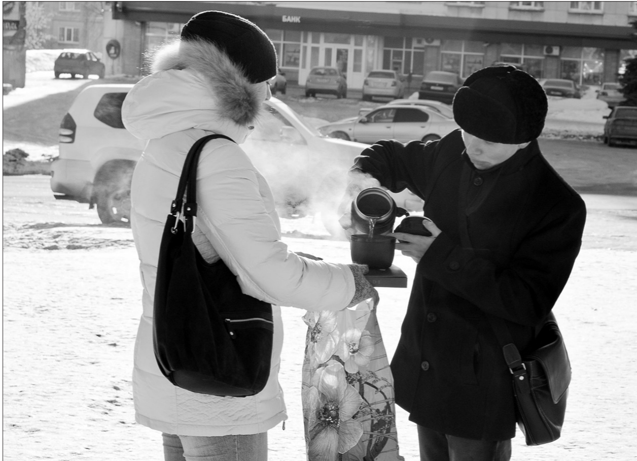
Согреться помогает чай из термоса.