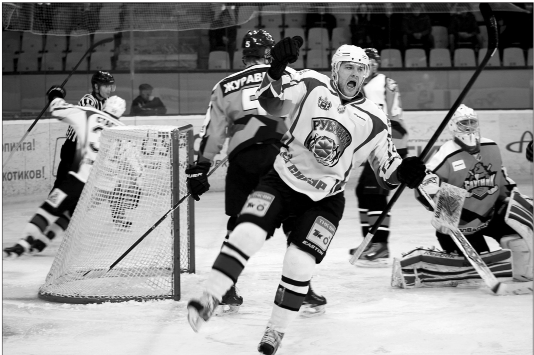
Радость тюменцев была недолгой, «Спутник» одержал уверенную победу.

В преддверии плей-офф «Спутник» проверил свои силы в матче с одним из лидеров ВХЛ – тюменским «Рубином». Финалист прошлого сезона был повержен со счетом 5:2. Напомним, в сентябре тагильчане победили в Тюмени в серии буллитов – 4:3.