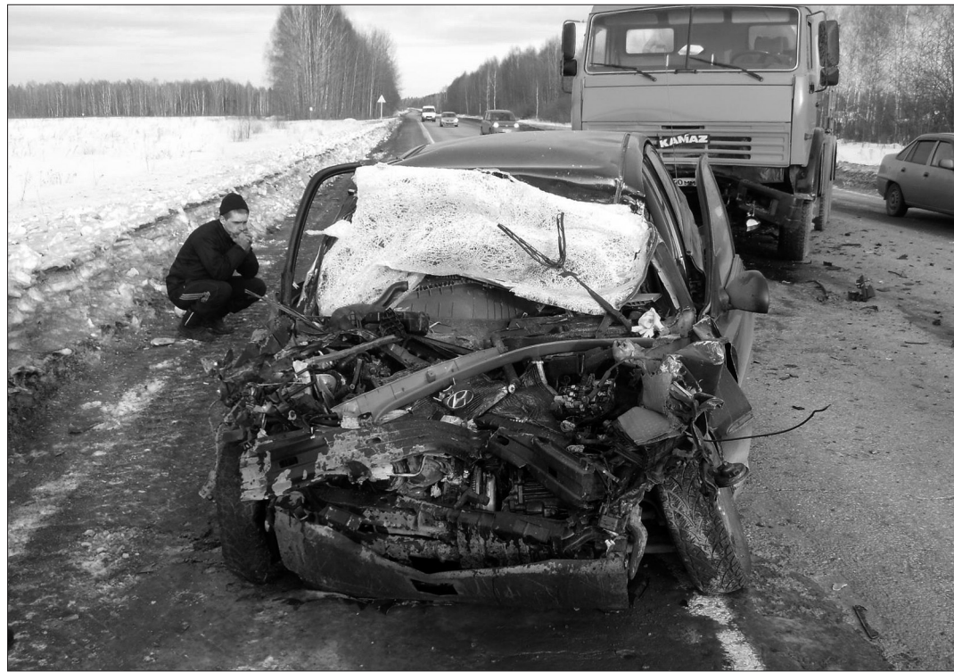
Автомобиль «Хенде-Акцент» восстановлению не подлежит.