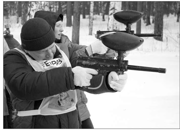
Пейнтбольный этап.

Традиция проводить военно-спортивные эстафеты среди сборных команд подшефных образовательных учреждений зародилась на Нижнетагильском металлургическом комбинате в 1988 году. После перерыва в 90-х десять лет назад она вновь была возрождена. В разное время школьники и студенты соревновались на территории Гальяно-Горбуновского массива (школа №69), в поселке Старатель и на стадионе «Уралец». Этой зимой они встретились в детском оздоровительном лагере «Баранчинские огоньки».