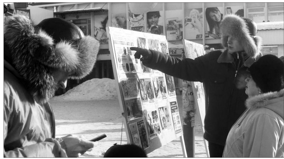
Прохожие внимательно изучали плакаты на стендах и слушали объяснения активистов общественного движения «Суть времени».