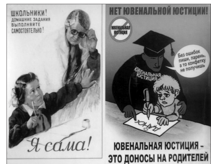
Один из плакатов.

Красные воздушные шары и стенды с яркими плакатами привлекли в один из воскресных дней внимание и взрослых, и малышей. Привыкшие к тому, что на площади напротив остановки «Пихтовые горы» постоянно идет торговля домашними соленьями, вязаными шляпами, медом и часто проводятся ярмарки, прохожие подошли к вопросу: «А что здесь продают?» и очень удивлялись, когда молодые люди предлагали поговорить о ювенальных технологиях и дарили ребенку воздушный шарик.