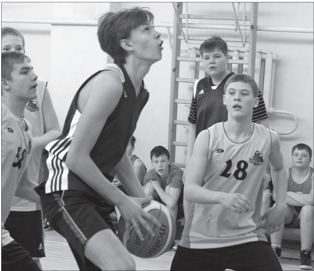
На площадке – баскетболисты школ №10 и 12.