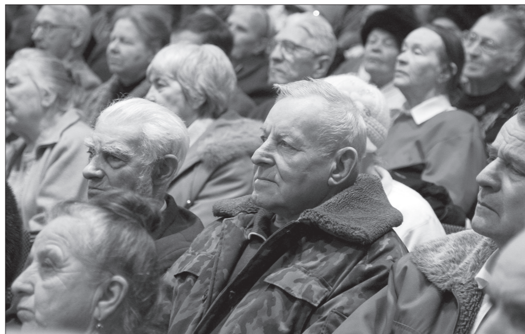
Жители Ленинского района слушают выступление мэра Нижнего Тагила Сергея Носова.

Геннадий Мальцев подчеркнул, что в Ленинском районе - 25 управляющих компаний, в других районах города количество УК намного меньше. Скорее всего, именно по этой причине у граждан воз-