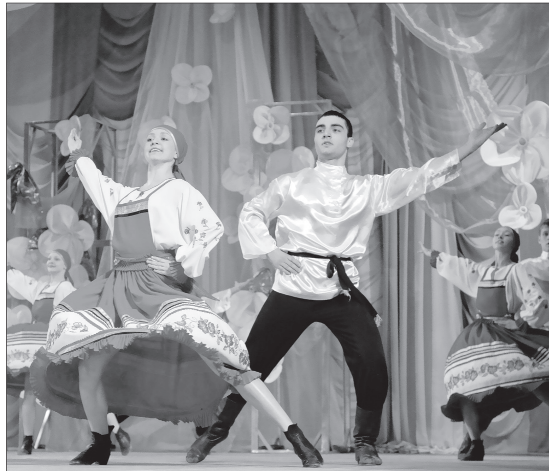
В подарок - концерт.