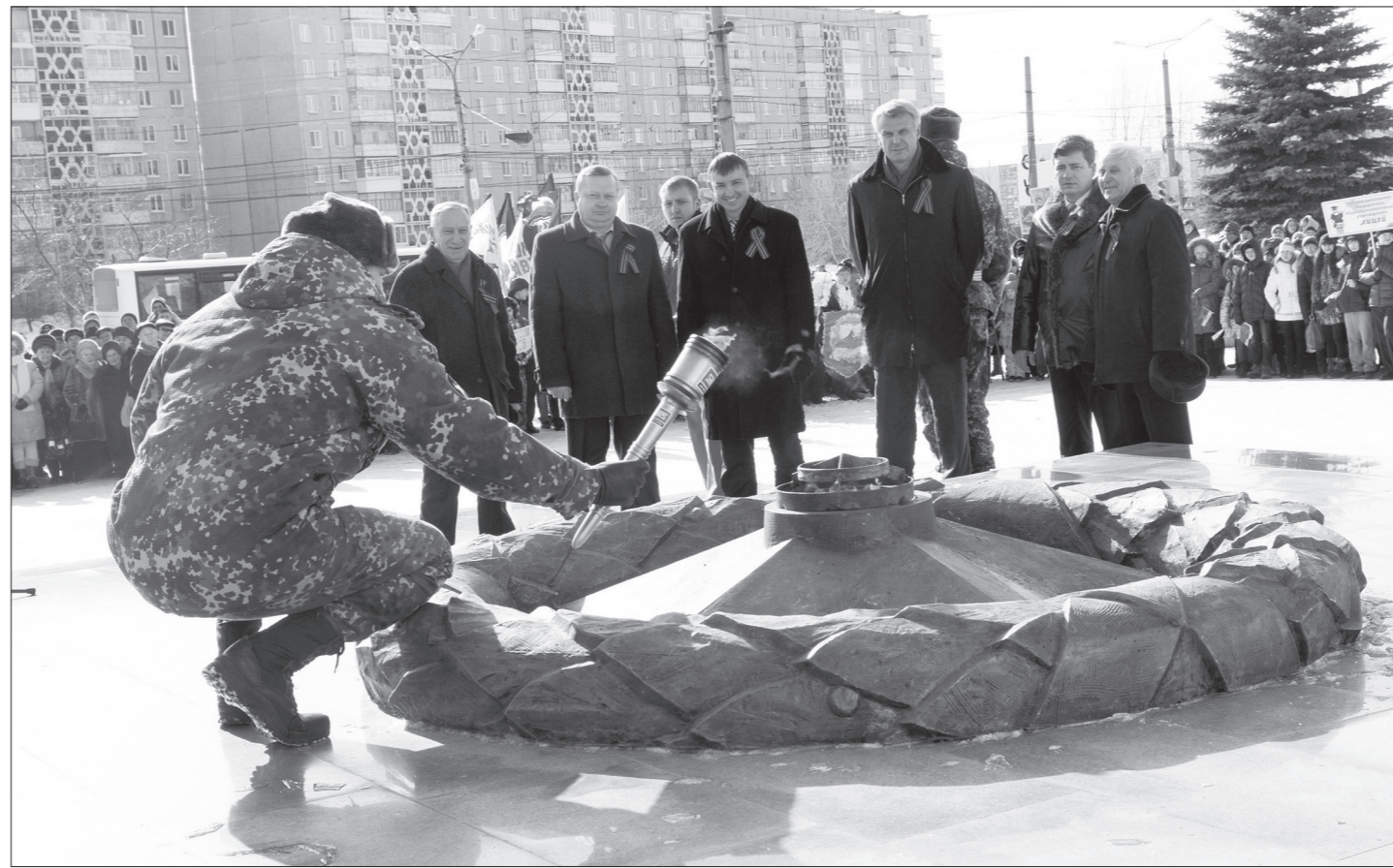
Торжественное зажжение Вечного огня.

– символ единства фронта и тыла. Цветы и венки были возложены не только к мемориалу и подножию памятника воинам и труженикам тыла на площади Славы, но и к трем тагильским памятникам-танкам: у центральной проходной Уралвагонзавода, на площади Танко-