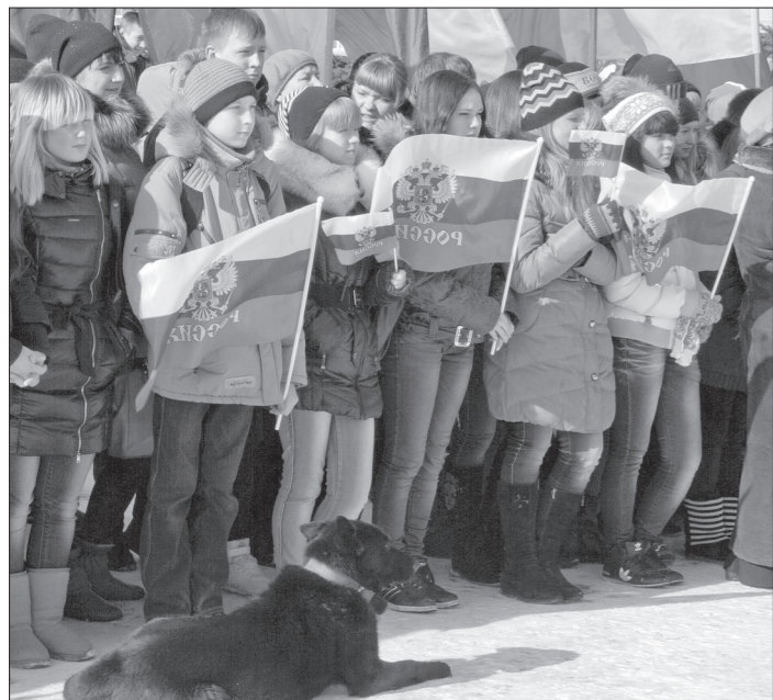
В митинге принимали участие представители предприятий и тагильские школьники.

На митинге выступили представители Уралвагонзавода, ветеранских организаций, учащихся города, и все отметили, что создание Уральского добровольческого танкового корпуса