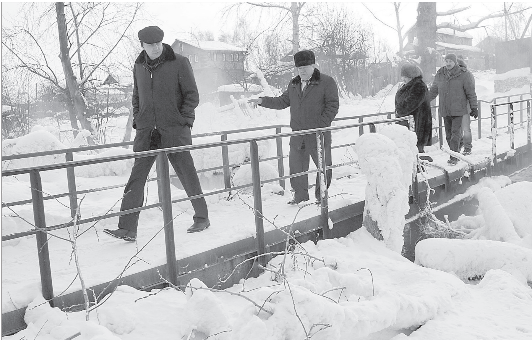
Побывали участники объезда на пешеходном мосту по улице Менделеева, который жителям хотелось бы перенести чуть в сторону, к дороге. Да и территория вокруг требует внимания: бурелом, покосившиеся столбы... Зато откуда-то из-под сугробов раздавалось громкое приветствие кваканье — даже зимой у незамерзающей речки бурилась лягушачья жизнь!

Во время непродолжительного заседания совета (оно проходило в гостеприимно открытой кабине директора ГДДЮТ) успели обсудить множество вопросов благоустройства поселка —