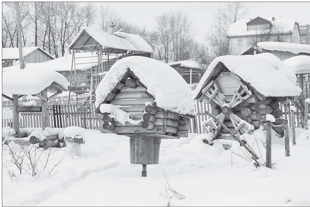
Самая первая ТОСовская площадка — на улице Менделеева. В снегопад она особенно живописна и сказочна.

как текущих, так и стратегических. Во-первых, планы по газификации, строительству водовода и канализационных сетей.